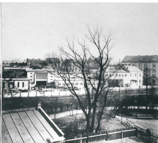
Celkový pohled na areál jatek po přestavbě. Zcela vlevo dobytčí trh, dále budovy porážek a ledárny, průčelí kancelářské budovy, zcela vpravo sprchové lázně, kolem r. 1930