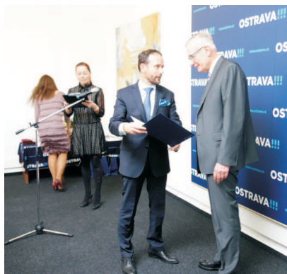
S primátorem města Ostravy při převzetí ocenění Senior roku.

"Nápad založit Výstavní síň Sokolská 26 vznikl shodou okolností v roce 1993. Do počátku devadesátých let jsem totiž pracoval jako inženýr ve Vítkovických železárnách. Po organizačních změnách, které v té době v tomto podniku probíhaly se však oddělení, ve kterém jsem pracoval, de facto rozpadlo. Takže jsem hledal uplatnění a našel jej v Centru kultury a vzdělávání v Moravské Ostravě. Moc kvalitní kultury se tam tehdy neprovozovalo (snad s výjimkou Klubu Atlantik). A tak jsem využil svého koníčka a sice dlouholetého zájmu o výtvarné umění a svých kontaktů s českými umělci. Tak vznikla Sokolská 26. Dnes je Centrum kultury skutečně centrem ostravské kultury a třeba Klub Parník nebo Minikino jistě není třeba zvlášť představovat."