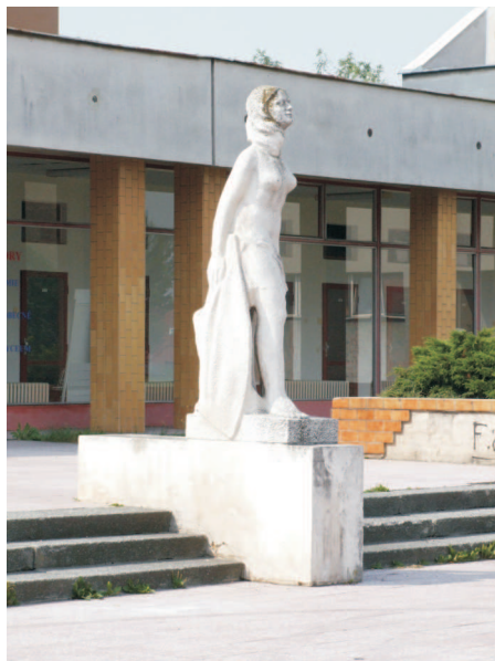
Václav Fidrich, Vzdělání, základ pokroku , 1982

nakročena do budoucího života, ztělesňuje socialistický ideál vzdělání a perspektivu mládí. Popisně a stereotypně jako protějšek postav horníků, slévačů nebo dělnic a zemědělců z generace jejich rodičů.