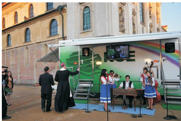
Při příležitosti oslav svátku slovanských věrosvětců sv. Cyrila a Metoděje požehnal na Velehradě olomoucký arcibiskup Jan Graubner za účasti českých a moravských biskupů nový přenosový vůz TV Noe. (rok 2007)

U vzniku televize Noe stálo občanské sdružení Telepace, skupina převážně mladých lidí, jejichž koníčkem byla tvorba filmů a televizních pořadů. Vysílání se postupně rozšiřovalo od počátečních několika hodin denně až po současné vysílání nepřetržité. Svými pořady oslovuje široké spektrum lidí: Vysílá filmy dokumentární i hrané, velký důraz klade na vážnou hudbu a folklor, nabízí i pořady pro děti a mládež. Významné místo mají besedy na nejrůznější témata, pravidelně zařazuje relace s outdoorovou tematikou a představuje neprofesionální filmaře i jejich díla. Ve středu zájmu jsou pořady duchovní, pravidelně vysílá významné liturgické slavnosti, a to i přímé přenosy z Vatikánu nebo ze zahraničních cest papeže, ale také z našich katedrál a kostelů. Zejména starší a nemocní lidé oceňují, že mohou prostřednictvím televize prožít bohoslužby, když se sami už do kostelů nemohou vypravit. Technické vybavení a profesionalita týmu umožňuje televizi Noe živě vysílat také z hudebních festivalů i dalších velkých setkání.