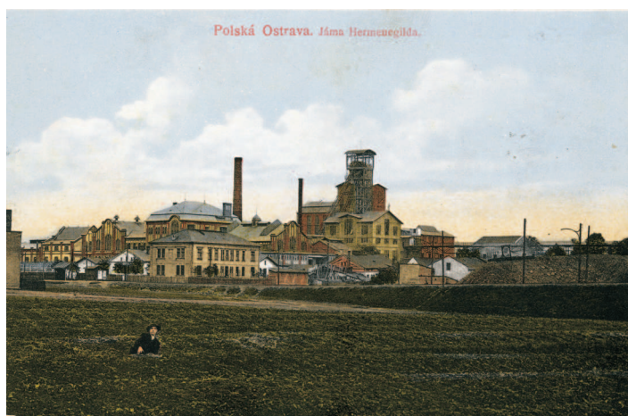
Pohled na důl Zárubek (do roku 1914 pojmenován Hermenegild) ve Slezské Ostravě na konci 19. stol.

Okresní hejtmán povolal do Zárubku četnictvo z Polské a Moravské Ostravy, Orlové a Fryštátu a později i tři setniny vojska z Opavy. Zloba horníků se též obracela proti závodnímu konzumu, který je okrádal. Teprve ve čtvrtek 1. prosince ráno, když mělo být do Zárubku k práci povoláno hornictvo z jiných závodů, byla týden trvající stávka zlomena a horníci začali pracovat.