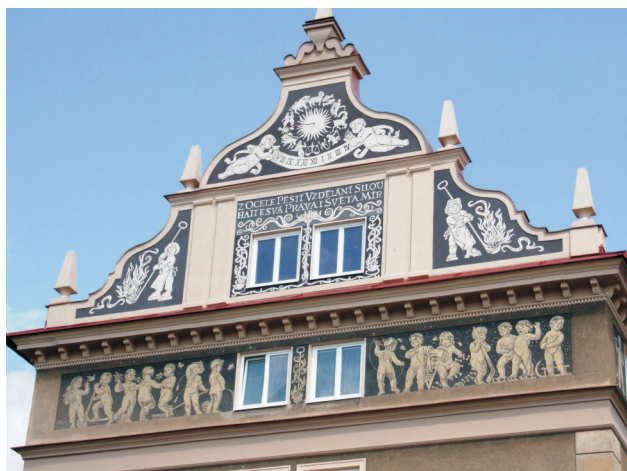
05 - Dům Věžičky, kolem poloviny 50. let 20. století