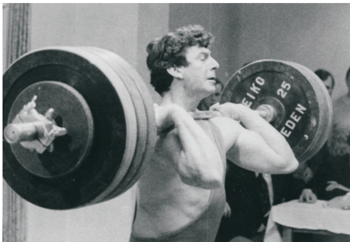
Hans Zdražila: V roce 1993 byl zvolen nejlepším českým vzpěračem století.

14. října 1964 československý vzpěrač Hans Zdražila, člen TJ Baník Ostrava získal na letních olympijských hrách v Tokiu zlatou medaili ve střední váze, první medaili ve vzpírání od roku 1932.