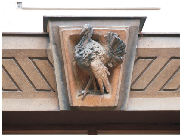
01 - Neznámý autor, Domovní znamení, 1. polovina 50. let 20. století