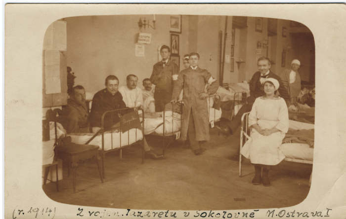
(r. 1914) Z voj. lazaretu v Sokolovně M. Ostrava I