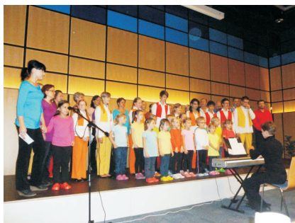
Dětské sborové studio Ostrava - Jih

O dobrou pohodu se svým vystoupením postarali členové Sborového studia Ostrava - Jih. „Jejich vystoupení nás všechny chytlo za srdce a domů jsme šli rozněžnělí“, vyjádřila své pocity Miluška Altmanová - jedna z nejaktivnějších senierek „školaček“.