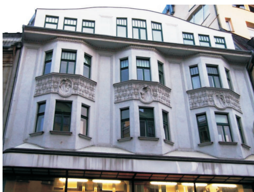
Dekorativní medailony, 28. října 39