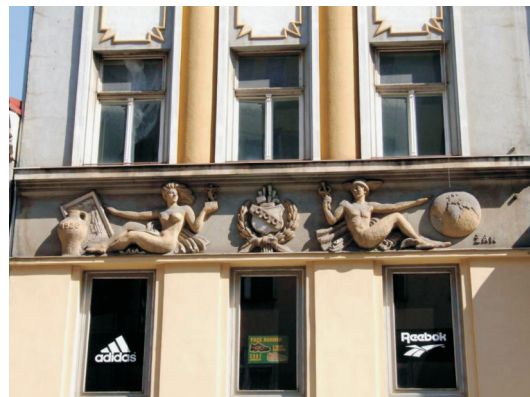
Bohatství a Obchod-Merkur, 28. října 37