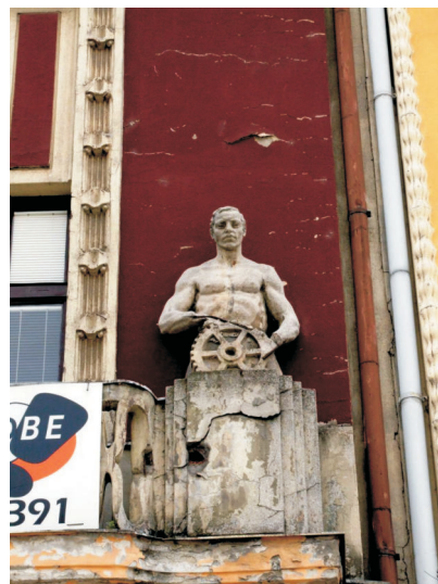
Kovář, Masarykovo náměstí 6