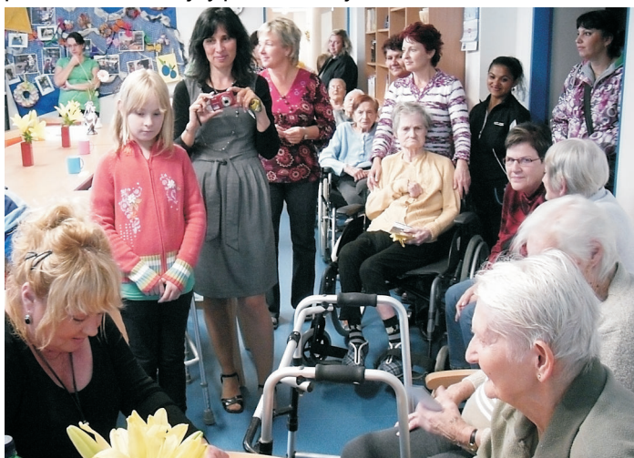
Ve společenské místnosti Zlatého slunce nebylo při autogramiádě k hnutí.

„Je to něco opravdu krásného, to jsou právě ty věci, které si nemůžete koupit. Na chodbě někdo říkal, že senioři měli z mé návštěvy větší radost a zážitek, než kdybych pro ně zpívala z pódia. Ovšem stejný pocit mám i já.“