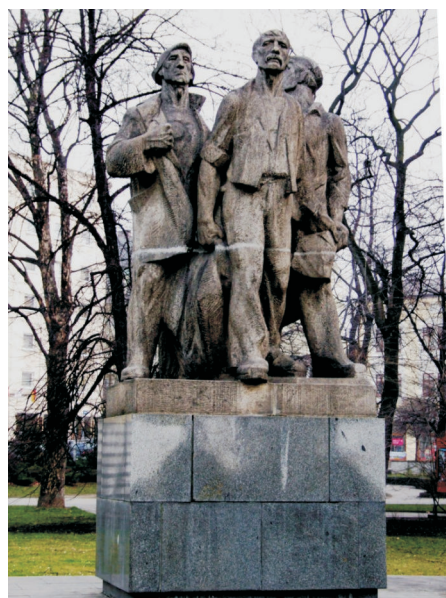
Památník revolučních bojů