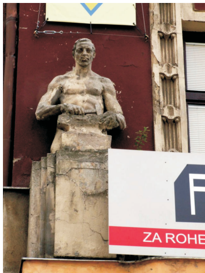
Strojník, Masarykovo náměstí 6