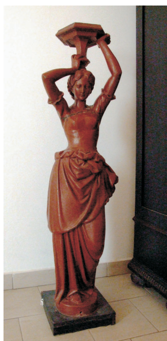
Torzo kašny z Masarykova náměstí, dnes Ostravské muzeum