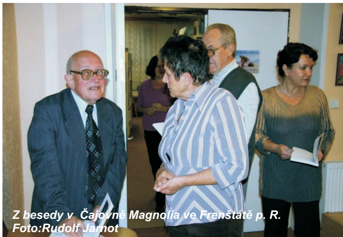
Z besedy v Čajovně Magnolia ve Frenštátě p. R.

Od dětství jsem rád četl a otcova knihovna s více než deseti tisíci svazky mne stále lákala. Na gymnáziu jsem vedl literární kroužek a začal s vlastními literárními pokusy. Bylo pro mne logické, že ve studiu literatury budu pokračovat i na vysoké škole. A měl jsem štěstí, že se mohu literatuře věnovat po celý život, v zaměstnání i v samotné tvorbě.