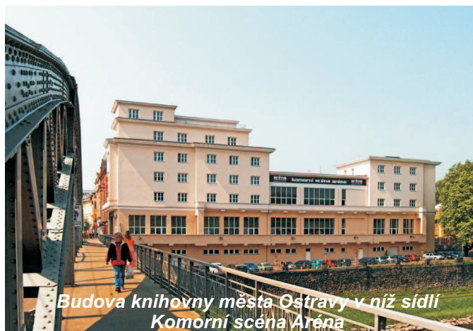
Budova knihovny města Ostravy v níž sídlí Komorní scéna Aréna

Narodila jsem se v Ostravě a mám-li být úplně přesná, pak můj nejranější život je spjat s Poděbradovou ulicí. Bydlela jsem tam, chodila do základní školy, pak gymnázium na Šmeralce a miniúlet do Olomouce. Nemám žádné herecké či divadelní předky - to už spíš ty produkční. Jedna z mých babiček, která náhodou bydlela přímo nad mou kancelář v Divadle hudby byla nadšenou ochotnicí. Jsem vdaná, mám syna, dceru a chlubím se už třemi vnoučaty. Myslím, že ze všech budou herci - tak to ti malí se mnou umějí.