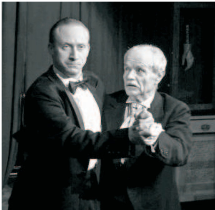
Ze hry Tango (rok 2005) - hra Sławomíra Mrożka

Není to třeba rozdělovat, připomenu zkušenost. Seděla jsem v našem divadle a slyšela následující: „Co to tady dnes je, v publiku jsou dědečkové a babičky?“ Musela jsem se smát, měli pravdu, v našem hledišti byla opravdu pestrá směsice věků, a to bývá téměř pravidlem. Dobrý divák ať má více roků přijímá i to nové, moderní a hlavně dobré jako ten mladý, jen je třeba tomu přijít na chuť, zvyknout si. Síla textu, myšlenky je určitě pohltní. Snad jediné co staršího diváka může odrazovat je v některých hrách vulgárnější slovník, jenže ten je přece odrazem dnešního světa, takže ani toho se snad nemusí bát.