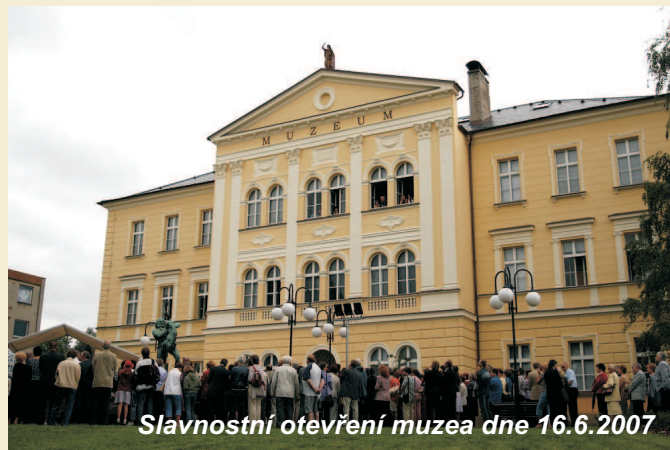
Slavnostní otevření muzea dne 16.6.2007

Muzeum nabízí devět expozic, které čerpají z historie, národopisu, zvyků, přírodního bohatství a vystěhovalectví obyvatel regionu v 19. a počátku 20. století do USA.