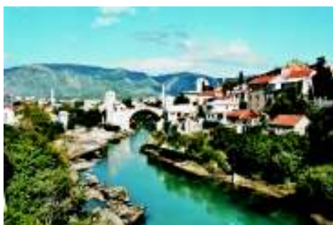
Mostar - nefalšovaný Orient kousek od Jadranu

V letošním roce uplynulo už 128 roků od chvíle, kdy bylo založeno Sdružení českých občanů Česká beseda Sarajevo. Po Mostaru mě provázela sličná muslimská blondýnka s modrými očima a nikomu nevadilo, že měla uplé satanské džíny, průsvitnou halenku a rudé rtíky od diorské rtěnky. A nikdo mě též nechtěl ukamenovat, že jsem jí podal ruku, hovořil s ní a udělal si pár jejích snímků. "Jsme hrdí na islámskou tradici, ale víru v Boha považujeme za přísně osobní věc každého, z níž se nesmí dělat politika," dodala. Most, který dal jméno městu jelikož ho kdysi hlídali „mostaré“, byl v r. 1566 na příkaz sultána Sulejmana Nádherného dostavěn slavným osmánským architektem Mimarem Hajruddinem. Má dvě věže-té na západní straně se říká Halebija a sloužila jako vězení a vojenská ubytovna, východní stranu zdobí věž Tara bez jediného okýnka, asi aby nikdo neviděl, kolik se tam skrývalo střelného prachu.