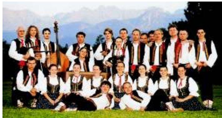
Soubor Valašský vojvoda

Soubor vystupuje v krojích rekonstruovaných na základě studia dobových materiálů z 2. pol. 19. století. Spolupracuje s Českou televizí, kde natočil pořady Zpívanky, Voničku z domova a další.