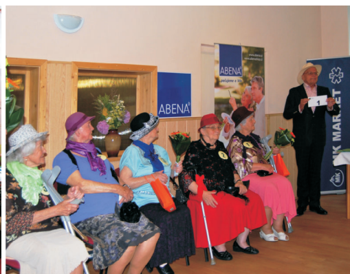
DD Nové Strašecí 10. 7. 2014

Děkujeme všem soutěžícím dámám i spoluorganizátorům...