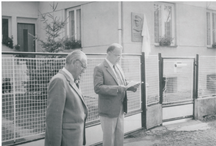
Odhalení pamětní desky Heliodoru Píkovy na jeho rodném domě ve Štítině 1. července 1989

1. července 1989 byla na rodném domku generála Heliodora Píky ve Štítině u Opavy odhalena pamětní deska. H. Píka, ruský a francouzský legionář, účastník 2. odboje a náčelník čs. vojenské mise v Sovětském svazu byl v květnu 1948 obviněn ze špionáže a nepřátelství k Sovětskému svazu a 21. 6. 1949 ve věznici Plzeň-Bory popraven. V roce 1968 byl plně rehabilitován.