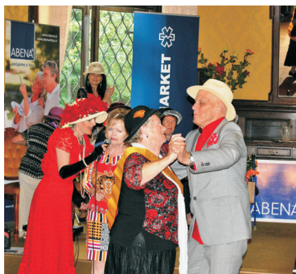
DPS Heřmanův Městec - 14.6.2014