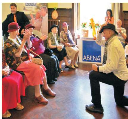
DD Čížkovice - 25. 4. 2014