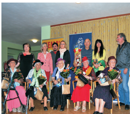
DD Nezdenice - 17.5.2014