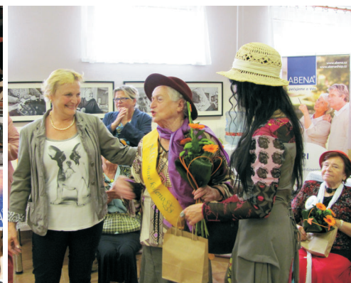
DPS Boskovice – 26. 6. 2014