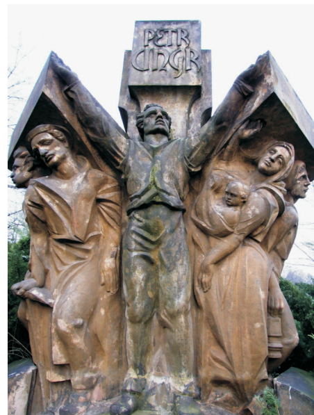
Rudolf Březa, Pomník Petra Cingra, 1921