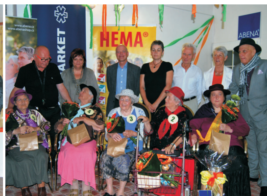
DD Onšov - 31.5.2014