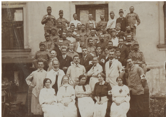
Ranění vojáci a jejich ošetřovatelé v jednom z ostravských lazaretů

11. září 1914 v noci do Moravské Ostravy přibyl dosud největší transport raněných vojáků z bojišť čítající asi 750 osob. Počet zraněných na Ostravsku tak dosáhl počtu 1200. Moravskoostravské lazarety jich tolik nebyly sto pojmout a tak byli umístěni také ve Vítkovicích, Zábřehu a Přívozu.