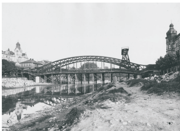
Pohled na rozestavěný říšský most. Jeho výstavba probíhala v letech 1912-1914