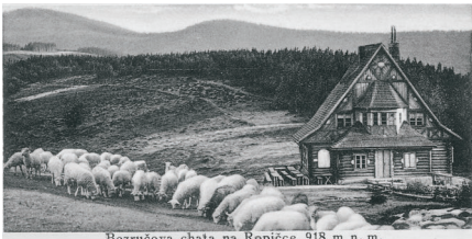
Bezručova chata na Ropičce. 918 m n. m.

6. července 1913 se konalo slavnostní otevření turistické chaty na Ropičce, první chaty polského "Beskidu". Chata v š a k n e m ě l a dlouhého trvání, na sklonku války v dubnu 1918 byla úmyslně podpálena neznámým pachatelem. Od jejího obnovení bylo upuštěno, neboť bylo přihlédnuto ke skutečnosti, že Ropička ležela poněkud mimo tehdejší frekventované turistické stezky. V roce 1924 zde byla otevřena nová chata, tentokrát česká.