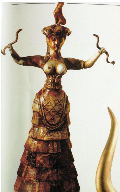
Kněžka-Bohyně s hádky, kol.r. 1600 př. n. l., Muzeum v Herakliu na Krétě

Tentokrát jde na rozdíl od stylizovaných, tvarově „primitivních“ idolů o postavy vytvořené se smyslem pro detail, podtržený ještě polychromií. Ženské postavičky záhadně gestikulují rukama, v nichž se v těch zachovalejších případech svíjejí kovoví hádci. Barevně i vlastním materiálem jsou zdůrazněny nejen detaily tváří, šatů i šperků, ale především horní poloviny těla formované od nápadně útlého pasu po naturalisticky zdůrazněné, obnažené (!) poprsí.