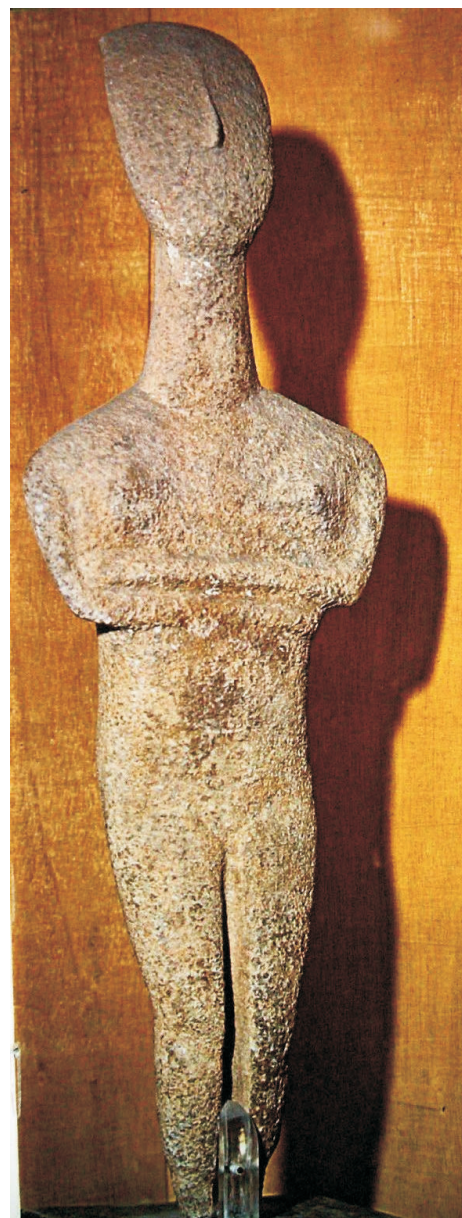
Kykladský idol, mramor, 3. tisíciletí před n. l., Britské muzeum, Londýn