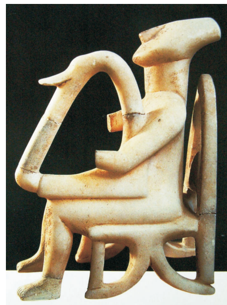
Harfista - Aiódos-Rapsód z ostrova Syros, 3.-2. tisíc. př. n. l.

Objeví se také Hráč na díaulos (tj. píšťec s dvojitou píšťalou, jež daleko později najdeme na výjevech archaického nebo klasického vázového malířství ve starověkém Řecku).