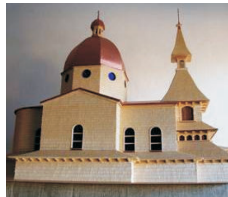
Model kaple na Radhošti