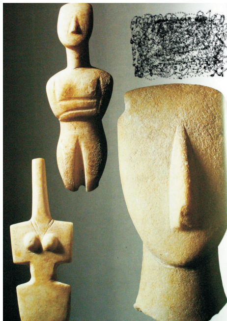
Kykladské idoly, 3. tisíciletí př. n. l.

Z určitého pohledu můžeme říct, že sochařské umění je bohatší než ostatní umělecké obory - malířství, grafika, umělecké řemeslo nebo architektura. Nebo jinak: ze všech oborů má něco a tím je oproti svým příbuzným výjimečné. S architekturou sdílí sochařství prostor, s malbou, kresbou a grafikou zase sdělnost, neboť zobrazení, námět anebo téma můžeme „číst“. Zatímco architektura (až na výjimky) není jako celek zobrazivá - témata jsou do ní vnesena právě prostřednictvím zobrazivých umění: sochařství, malby či mozaiky. Malba a grafika sice zobrazují, ale jsou plošné, prostor vytvářejí na ploše pouze iluzivně. Na objemu se barva nebo kresba projevuje, právě když spolupracuje se sochařem nebo architektem.