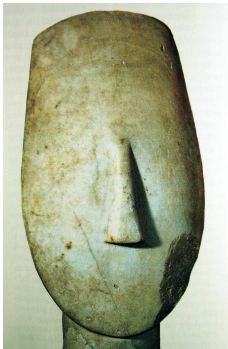
Kykladský idol, mramor, 3. tisíciletí př. n. l.

Tentokrát jde na rozdíl od stylizovaných, tvarově „primitivních“ idolů o postavy vytvořené se smyslem pro detail, podtržený ještě polychromií. Ženské postavičky záhadně gestikulují rukama, v nichž se v těch zachovalejších případech svíjejí kovoví hádci. Barevně i vlastním materiálem jsou zdůrazněny nejen detaily tváří, šatů i šperků, ale především horní poloviny těla formované od nápadně útlého pasu po naturalisticky zdůrazněné, obnažené (!) poprsí.