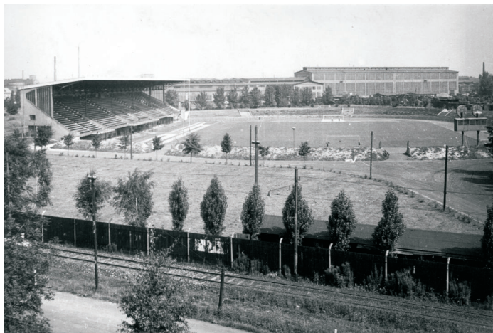
Pohled na vítkovický stadion v 60. letech minulého století

25. září 1913 se ve Vídni narodil hráč a trenér kopané Josef (Pepi) Bican. V roce 1949, když se stal komunistickému mocenskému aparátu nepohodlným, přestoupil z pražské Slavie do ostravského klubu TJ Sokol VŽKG Vítkovice.