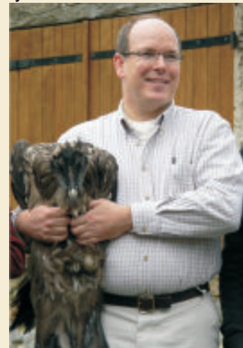
Monacký princ Albert II.