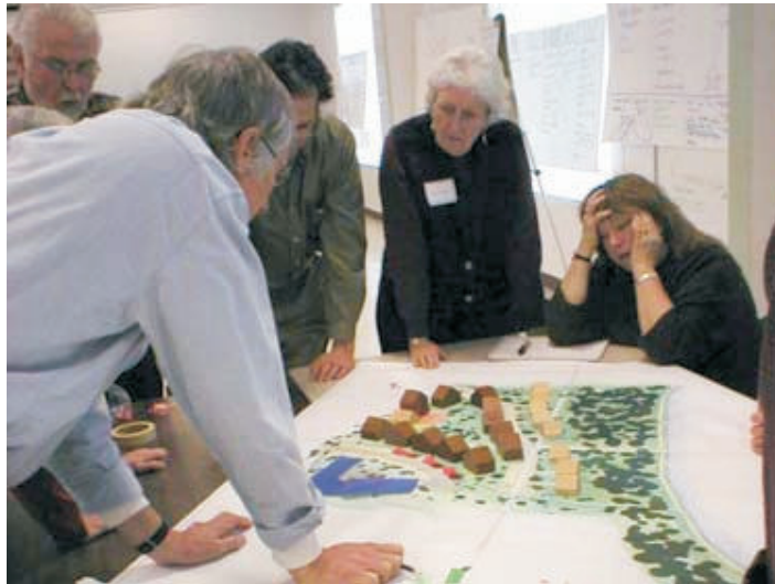
Budoucí obyvatelé senior cohousingu Wolf Creek Lodge v Kalifornii diskutují nad projektem. Začátek realizace léto 2009, nastěhování podzim 2010. Zdroj: www.seniorcohousing.com

Obecná představa o domovech důchodců je, že se jedná o odkládku starých lidí, kteří sem přichází dožít, i když jsou dnes mezi domovy výjimky, které se snaží zajistit seniorům naplnění jejich emocionálních i sociálních potřeb, krom potřeb fyzických a střechy nad hlavou. Kapacity v těchto domovech jsou však nedostatečné a dlouhé čekací lhůty na umístění jsou už teď, natož až přibude rychlým tempem počet seniorů z generace dnešních padesátníků a třicátníků.