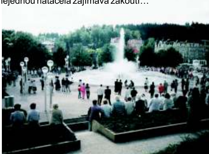
Foto ze zdařilého zájezdu po západočeských lázních