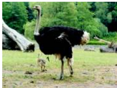
Pštrosí mládě "Metelka" se samcem "Jeníčkem", který vejce vyseděl

Zahájení prohlídky bude v 10 hodin ve vstupu do zoologické zahrady.