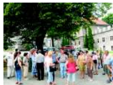
Na nádvoří ve Smolenici

Poslední zastávkou na putování Slovenskem byl poutní chrám v Šaštíne, kde účastníci zájezdu obrátili svou pozornost od materiálních požitků k hodnotám duchovním. Vznik basiliky sahá až do roku 1736, kdy začali tehdejší basiliku společně s přilehlým klášterem stavět řeholníci svatého Pavla - pavlíni. Dnes je klášter i basilika ve správě Řádu salesiánů.