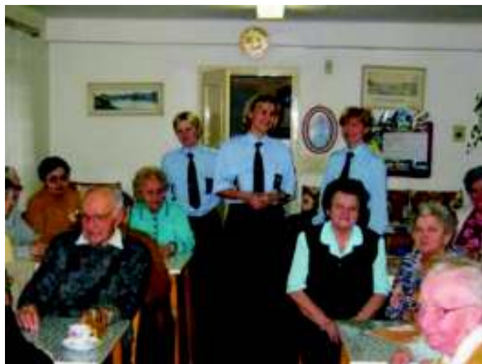
Zástupci Městské policie na besedě mezi seniory

Oddíl prevence a dohledu Městské policie Ostrava