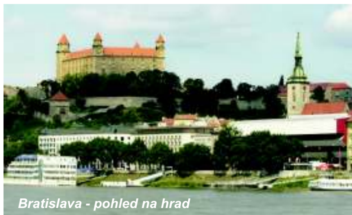
Bratislava - pohled na hrad

Pěší procházka Bratislavou při teplotě okolo třiceti stupňů nad nulou byla sice fyzicky náročná, přesto však po ní zvládli téměř všichni účastníci zájezdu ještě výstup na Děvín. Na vrcholu centra Velkomoravské říše byli odměněni pohledem do krajiny s majestátným veletokem Dunaje a jeho soutokem s Moravou. Zatímco ceny za občerstvení v bratislavském centru vypovídají o čilém turistickém ruchu a blízkosti Vídně, pod Děvínem se mohli všichni osvěžit za sumy celkem přijatelné.