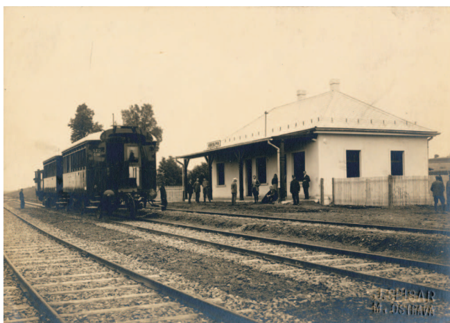
Nádraží trati Svinov-Kyjovice ve Vřesíně, 1925

4. června 1923 byly započaty práce na stavbě dráhy Svinov-Kyjovice, když byl předsedou Zemské správní komise pro Slezsko dr. Pelcem ve Svinově u mostu přes Porubku proveden první slavnostní výkop půdy. Realizaci stavby získala firma Bratři Špačkové ze Slezské Ostravy. Provoz na prvním úseku ze Svinova do Vřesiny dlouhém 6,7 km byl slavnostně zahájen 2. srpna 1925. Dne 6. listopadu 1927 pak dojel za zvuků fanfár ze Smetanovy Libuše a za účasti asi dvou tisíc občanů první slavnostní vlak do Kyjovic-