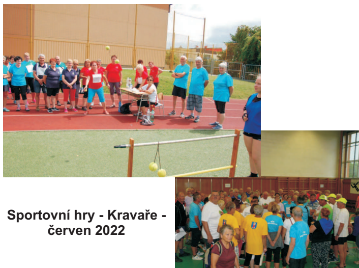
Sportovní hry - Kravaře - červen 2022

1. Krajské sportovní hry seniorů 24. května v Mořkově. Tyto hry jsou, v době, kdyby budete číst tyto řádky, již historií. Na hry bylo přihlášeno 77 družstev o 308 sportovců a k jejich přepravě jsme zajistili šest autobusů. Jsem přesvědčen, že hry se všem líbily, ale o tom až v reportáži v dalším čísle SeniorTipu nebo na našich webových stránkách.