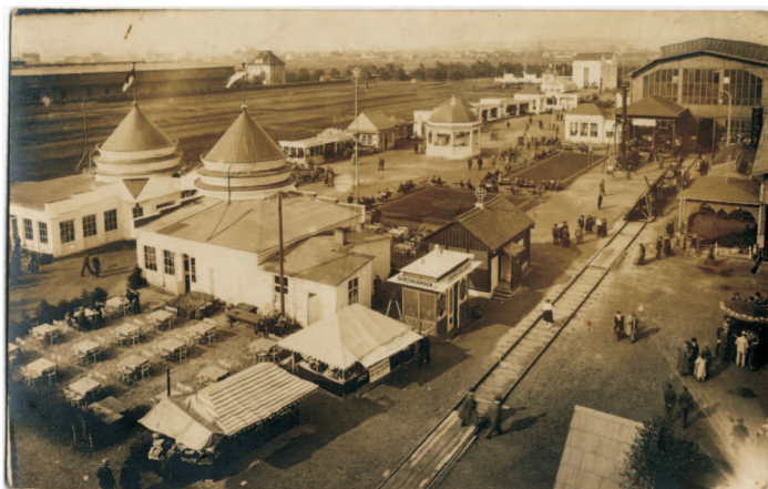
Celkový pohled na areál Průmyslové a živnostenské výstavy v Moravské Ostravě 1923

PhDr. Antonín Barcuch, Archiv města Ostravy