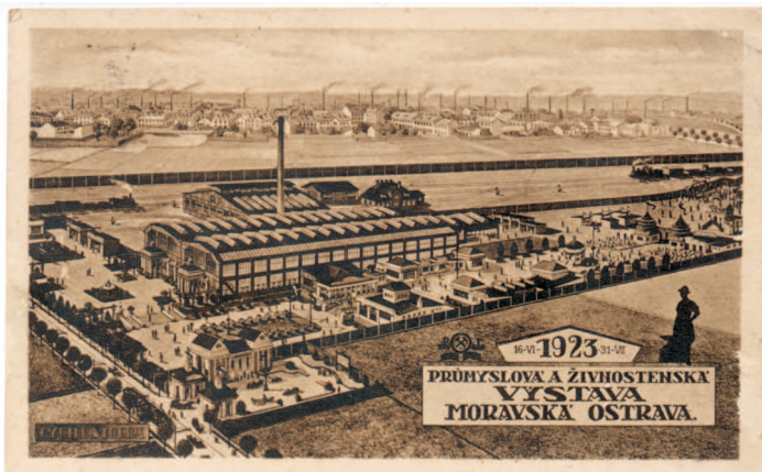
Schéma výstaviště Průmyslové a živnostenské výstavy v Moravské Ostravě 1923