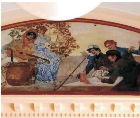
Detail lunety - Hráčská scéna, dle návrhu Karla Ludwiga Hassmanna

Malířské scény v čelních lunetách jsou obecně tematizovány hrou. (V dostupných zdrojích se uvádí pouze příjmení Hassmann jako architekt.) Z původního mobiliáře se podařilo zachránit barový pult, nástěnné skříňky a prvky osvětlení. Prostorový a světelný efekt interiéru je znásoben zrcadly.