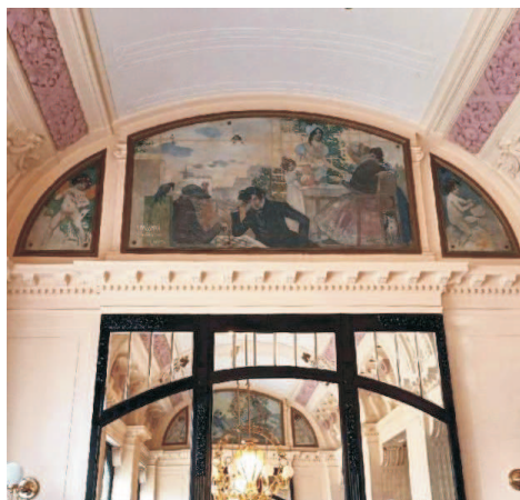
Efekt zrcadlení s malbami v lunetách