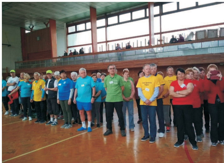
Krajská rada seniorů ČR - sportovní hry seniorů, sportovní hala TJ Pustkovec