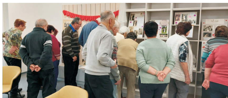
Klub seniorů Řepiště - Valentýnská výstava