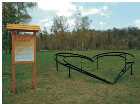
Vzpomínková srdce v ostravském Bělském lese

Jsou tichou vzpomínkou na všechny, kteří nás opustili při covidu