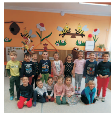
Děti z MŠ E. Holuba v Havířově