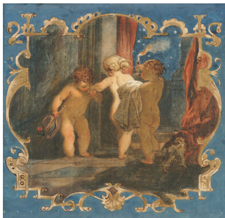
Dobrou noc, Život na panském sídle, nástěnná malba, cca 1856

Dnes možná budeme nahlížet na tvorbu Josefa Mánesa jako na století a půl minulou historii, ale tento muž měl se současnými intelektuály nebo umělci mnoho společného - už, a hlavně tím, jak se z průměrné společnosti vylučoval. Na fotografiích i portrétech vyniká jeho vysoká, hubená postava, orlí nos a hluboko posazené oči zahleděné do dálky. „ I pohyby jeho byly nápadné a zvláštní, i způsob mluvení, ano i v oblékání jevil jakousi neobvyklost, někdy až výstřednost, “ zaznamenala jedna z jeho současníc.