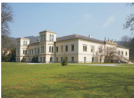
Zámek, pohled od jihozápadu

Než došlo ke stavebnímu podnikání Sylva-Tarouců, šlechtického rodu původem z Portugalska, středověkou tvrz ze 14. století vlastnili Boskovicové a Pernštejnové. Do renesanční podoby přestavěli objekt majitelé v polovině 16. století. Z té doby se v západním a jižním křídle dochovaly nejstarší části klenu a iluzivních maleb.