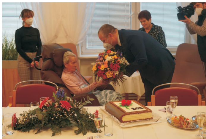
Mimořádná oslava s mimořádnou kyticí a dortem

„Organizujeme aktivizační programy a pořádáme kulturní akce. Mezi ty zvláště zdařilé řadíme kouzelnické představení, které se uživatelům velmi líbilo. V závěru představení kouzelník poodhalil některé ze svých triků a uživatele pozval ke společnému kouzlení. Tradičními akcemi pak byly zahradní slavnosti na ulici Rybářské a vinobraní na ulici Rooseveltova.“