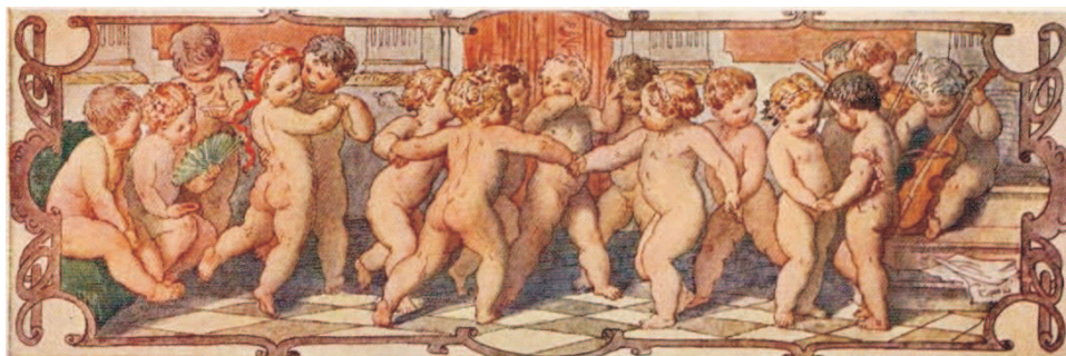
Tanec, Život na panském sídle, akvarel, 1856

Jiní připomněli výjimečnost jeho vzdělání, intelektu a úsilí o prosazení českého elementu v umění i politice. „...oplýval duchem... i vtipem,“ dodává malíř a kritik umění, Mánesův současník Eduard Herold.