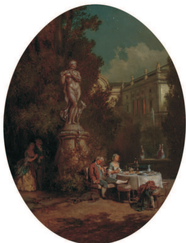
Při měsíčku, olej, plátno, 1853-55

Skvělým souborem vycházejícím z pozorování i prožitku jsou drobné kresby „okamžiku“, dokumentující život zámeckého osazenstva i okolí. Doprovázejí události v knize hostů ilustrují německou báseň Hanselburg , romantickou travestii klasické pohádky o Honzovi - tam Mánes zachycuje např. hr. Augusta při práci na soustruhu nebo hr. Bedřicha uprostřed záplavy knih.