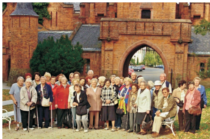
Společné foto klubu seniorů Elim v Hradci nad Moravicí

„Většina našich seniorek má 80 až 90 let, i více. A tak na setkání do klubu je často přivázely jejich děti. Některé seniorky již žily v domovech pro seniory, kde jsme je mohli navštěvovat při příležitostech jejich narozenin, apod. V průběhu let nám již zemřelo 62 seniorek. V současnosti se v klubu schází 20 až 30 seniorů.“