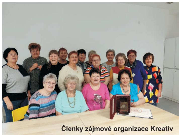
Členky zájmové organizace Kreativ

"Život bez bariér". Kreativ se také zapojil do projektu, který byl organizován Úřadem městského obvodu Ostrava-Poruba s tématem pletení ponožek a chobotniček pro předčasně narozené děti v neonatologickém oddělení FN Ostrava-Poruba. Dále členky této ZO upletly a darovaly teplé ponožky seniorkám a seniorům v domovech důchodců.