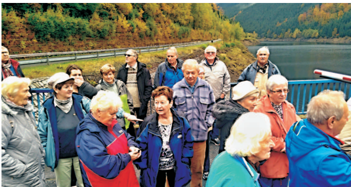
Snímek z výletu na Dlouhé Stráně

„Většina seniorů vyrostla v ateistické společnosti, kde se tvrdilo, že Bůh neexistuje a to co píše Bible, jsou pohádky pro mentálně zaostalé lidi. Takže víra a Bible byly velkou neznámou. Když jsme pracovali v klubu seniorů Elim přebírali, věděli jsme, že - jako každé aktivitě - tomu budeme muset dát mimo jiné svůj volný čas. Navíc, většina seniorek je bez životního partnera a mnohdy nemá o koho se opřít a jak smysluplně využít vlastní čas. Naše nabídka tedy zní "nezůstat sami". Sdílet se s druhými, se svými radostmi i starostmi.“