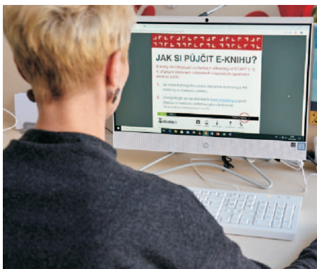
Služba Info Help

Velmi oblíbené jsou také naše kurzy trénování paměti, které pro zájemce připravují již 3 trenérky paměti 1. stupně. Jako jedna z nich si vás dovoluji pozvat na ukázkové lekce, které budeme určitě po prázdninách pořádat. Jejich termíny zveřejňujeme s předstihem na webových stránkách knihovny www.svkos.cz .