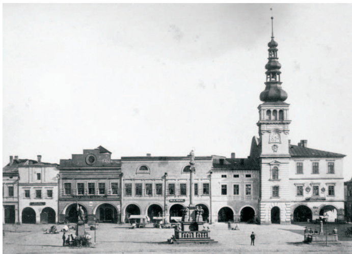
Radniční strana náměstí s mariánským sloupem, sochou sv. Floriana a kašnou kolem roku 1880

2. a 3. dubna 1960 odstranilo v rámci "estetizace" 600 příslušníků Lidových milicí, členů civilní obrany a Čs. červeného kříže pomocí bagrů, autojeřábů a další mechanizace z náměstí Lidových milicí (dnes Masarykovo náměstí) veřejné toalety, trafiky, kašnu a především "religiózní" mariánský sloup z roku 1702 a sochu sv. Floriána z roku 1763. Podél chodníků byly umístěny osmimetrové sloupky veřejného osvětlení a začaly úpravy místa, kde byla posléze v roce 1962 instalována socha milicionáře, jejímž autorem byl Vladislav Gajda. Akce, která probíhala rovněž v noci, byla příspěvkem Lidových milicí k 15. výročí osvobození Ostravy. Mariánský sloup, nejstarší dochovaná barokní plastika ve městě, se vrátil na náměstí 24. října 1992. Socha sv. Floriána byla v roce 1983 umístěna u kostela v Hrabůvce a na Masarykovo náměstí se po zrestaurování vrátila až 4. května 2008.