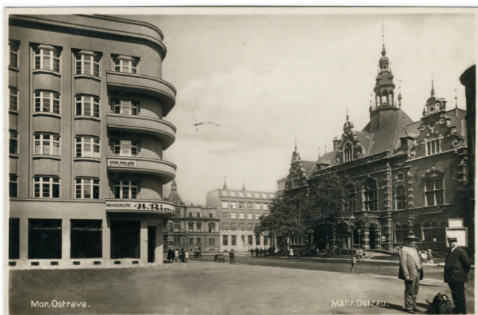
Německý dům (zcela vpravo) v Moravské Ostravě, pohled směrem na dnešní náměstí dr. Edvarda Beneše, 30. léta 20. století