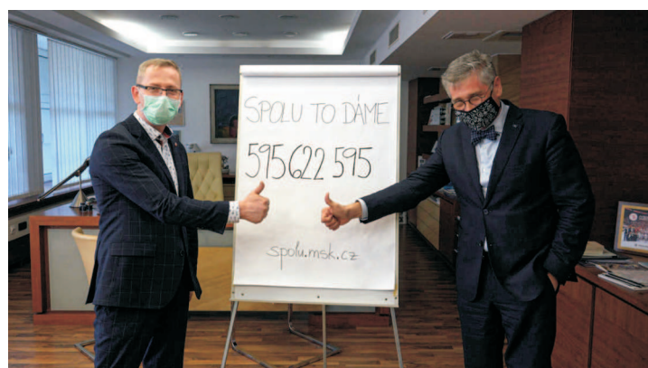
Náměstek hejtmána Jiří Navrátil a hejtmán MSK Ivo Vondrák (vpravo)

„Klíčové bylo spuštění portálu Spolu to dáme, kde lidé mohou nabízet a využívat dobrovolnickou pomoc. Mezi dobrovolníky se hlásí fyzické osoby i organizace, a to prostřednictvím finanční nebo materiální podpory.“