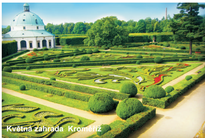
Květná zahrada Kroměříž

Označení park se používalo již ve středověku pro lovecké obory, z nichž některé se v průběhu století přeměnily na parky, např. pražská Stromovka. Park, jak jej známe dnes, neboli sad s okrasnými stromy a květinami, se začal formovat v Anglii v 18. století převážně u šlechtických sídel. Vznikl na protest proti barokní přísně geometricky tvarované zahradě francouzského typu. Všimnout si rozdílů mezi francouzskou zahradou a anglickým parkem můžeme např. v Kroměříži. Podzámecká zahrada je příkladem romantického anglického parku, Květná zahrada příkladem pečlivě zastříhané francouzské zahrady.