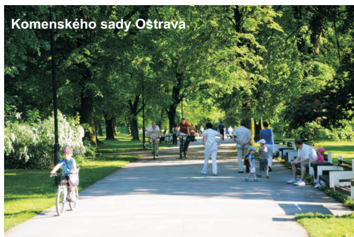
Komenského sady Ostrava

dovací a rekreační. V parcích se setkávají lidé, pořádají se zde kulturní a sportovní akce. Parky nám umožňují zregenerovat tělo a harmonizovat duši. Stromy a květiny v parku snižují teplotu vzduchu, hluchost a prašnost. Odštiňují světelné znečištění a zvlhčují klima. Pozorování barevnosti a morfologické rozlišení vyvolává v pozorovateli ozdravné procesy, pocit klidu a bezpečí.