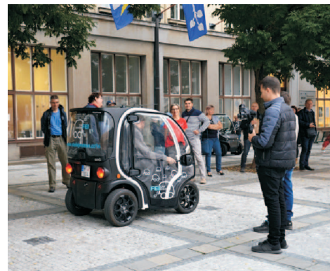
Noc vědců před knihovnou - jízda elektromobily