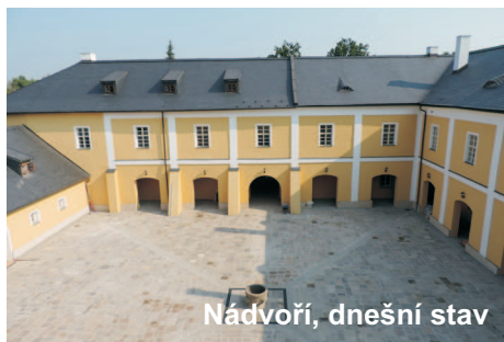
Nádvoří, dnešní stav

▲ Zámek v Rychvaldu (před rekonstrukcí) měl svá nejlepší léta, kdy byl plně obývaný a udržovaný, za sebou už v 19. století. Tehdy se ze šlechtického sídla stal objekt sloužící převážně zemědělským účelům. Jako by se obloukem vrátilo jeho dávné určení. Kořeny místa sahají totiž až do pozdního středověku, kdy se na místě nacházel hospodářský dvůr. Ten patrně patřil benediktinskému klášteru v Orlové; benediktini se v těšínském Slezsku mj. významně podíleli na osídlování regionu a zúrodnování půdy. Odtud se až dodnes udrželo označení jejich rychvaldského majetku - Starý dvůr. Je to i název zastávky, na níž byste přímo před zámkem vystoupili.