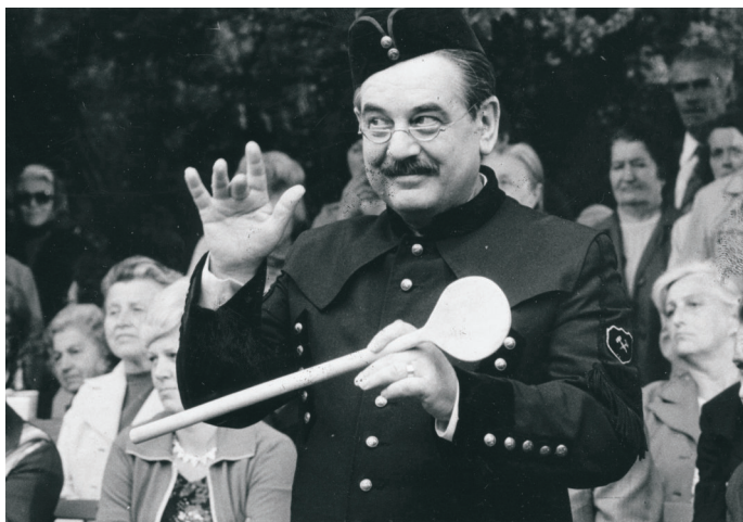
Josef Kobr při televizním natáčení v roce 1979

25. května 1929 bylo zahájeno pokusné (od 1. července pravidelné) vysílání moravskoostravské rozhlasové stanice Radiojournal v Moravské Ostravě. Tehdejší rozhlasový vysílač ve Svinově byl slyšitelný v celé střední Evropě. Vysílalo se 3 hodiny denně od 19 do 22 hodin a další program se přebíral z Brna a Prahy. Rozhlasové studio bylo zřízeno v prvním patře německé hasičské zbrojnice na rohu dnešního Smetanova náměstí a Vojanovy ulice. V provizorních podmínkách tam pracovali průkopníci rozhlasového vysílání až do roku 1937, kdy se přestěhovali do nově adaptovaného domu na dnešní ulici dr. Šmerala, kde rozhlas sídlí dodnes.