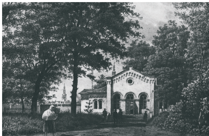
Stará střelnice na pravém (slezském) břehu Ostravice

29. května 1854 byly sepsány spolkové stanovy Střeleckého spolku v Moravské Ostravě. Spolek byl založen již v roce 1841, avšak v roce 1847 byl nucen ukončit činnost. Důvodem byl zákaz střelby a uzavření střelnice (stála v místech dnešní železniční stanice Ostrava-střed), která se ocitla v nebezpečné vzdálenosti od nově vybudované silnice, spojující Vítkovické železářny s dnešní ulicí 28. října. Ani s umístěním druhé střelnice, postavené v roce obnovení činnosti, neměl spolek štěstí. Střelnice na pravém břehu Ostravice byla 17. června 1872 zničena náhlým přívalem vody z rozvodněné řeky. Při povodni přišel o život účtující číšník, ostatní personál unikl na poslední chvíli. Po katastrofě ze Střeleckého spolku vystoupilo 37 členů.