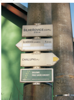
Bohumín - Šilheřovice - Petřkovice