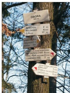
Luhačovicko, Bílé Karpáty...