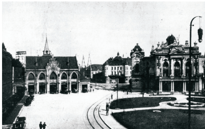
Antonínovo (dnes Smetanovo) náměstí na počátku 20. stol., vlevo budova hasičské zbrojnice, kde sídlil ostravský rozhlas, vpravo od něj dnešní divadlo A. Dvořáka

16. května 1954 se obec Výškovice, která byla k Ostravě připojena 1. 7. 1941, opět osamostatnila. Dne 24. května se uskutečnilo ustavující plenární zasedání místního národního výboru, který se tak ujal správy obce. Od tohoto data obec také disponovala vlastním rozpočtem, což mělo okamžitý kladný účinek. Ihned bylo započato s opravou a adaptací staré školy, na kterou se od konce války nenašly finanční prostředky a jež svým vzhledem hyzdila okolí. Další investice směřovaly do stavby kanalizace a rekonstrukce komunikací. Našly se i peníze na zakoupení vůbec prvního televizoru v obci, který byl instalován ve školní budově a těšil se velké pozornosti výškovických občanů.