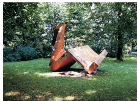
Yves Trudeau: Bez názvu (1967)