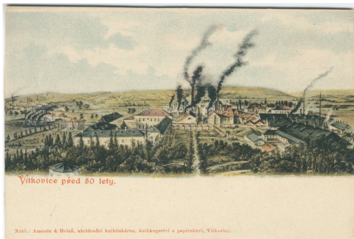
Pohled na Vítkovické železárny kolem roku 1855

8. dubna 1843 Vítkovické železárny se vším příslušenstvím přešly kupní smlouvou (byla podepsána v Olomouci a v Paříži) z vlastnictví olomouckého arcibiskupství do rukou vídeňského bankéře Salomona Mayera Rothschilda za kupní částku 321 tisíc zlatých. Vzápětí poté se Rothschild vyrovnal s ostatními členy Vítkovického těžírstva tak, že jim proplatil jejich podíly. Od tohoto roku se datuje postupné vytlačování feudálních podnikatelů, ať to byli Wilczkové, nebo olomoucké arcibiskupství, z jejich takřka výhradních pozic v těžbě rudy, uhlí a výrobě železa, ve prospěch klasického kapitalistického podnikatele. V roce, kdy Rothschild od olomouckého arcibiskupství Vítkovické železárny převzal, to již byl podnik nezvyklého rozsahu a značné výrobní kapacity. Zaměstnával asi 1500 zaměstnanců ve vysokopecní výrobě, slévárně, pudlovně a válcovně, kovárně, kotlárně, vrtárně a soustružárně a cihelně.