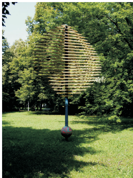
Š. Belohradský: Zázračný strom

Tím však éra socialistické výstavby a výzdoby místa, které se mělo napojením na Dům kultury stát i v dalších nerealizovaných projektech kulturním prostorem, skončila. Na místě, kde stálo krematorium, zůstala slepá plocha, v ideovém plánu určená pro fontánu.