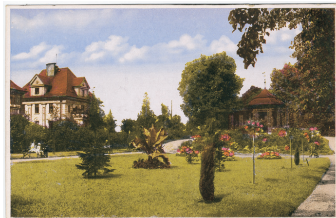
Komenského sady – altán a růžový sad ve 30. letech 20. stol.

26. dubna 1928 Ostravský deník uveřejnil zprávu o projektu zřídit v Moravské Ostravě rozšířením Komenského sadů velký park.