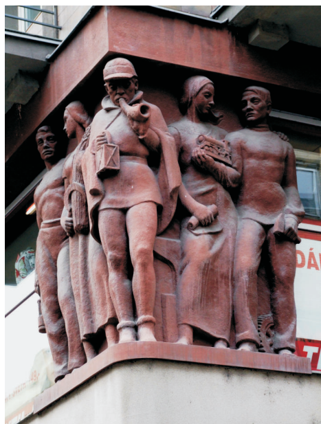
Palác pojišťovny Riunione Adriatica, střední část reliéfu