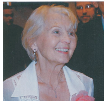
Rok 2005: 50. výročí ČT Ostrava