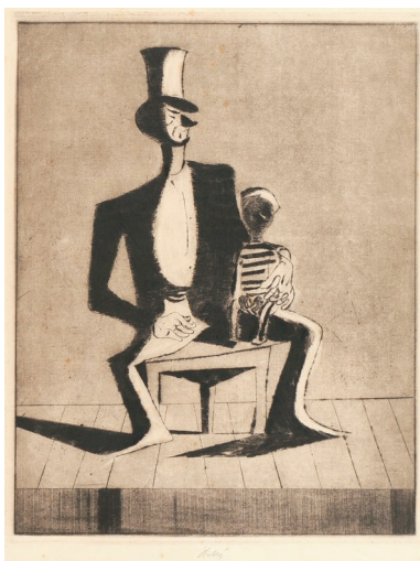
František Tichý, Břichomluvec II., 1948, papír, lept, 40,5x31,5 cm

Představuje díla Františka Tichého z fondu Galerie výtvarného umění v Ostravě, jednoho z nejpozoruhodnějších umělců české výtvarné scény 20. století. Tichý byl nejvíce ovlivněn uměleckými směry romantismem a poetismem. Z jeho děl je cítit určitá naléhavost i melancholie. V mnoha ohledech právě tyto prvky gradují v jeho tolik obdivovaném cirkusovém prostředí, které výstava přibližuje. Jméno umělce je spojováno se světem klaunů, žonglérů a artistů, se kterými se seznámil v rodné Praze. Tato láska a obdiv k cirkusovému světu jej provázela až do konce života. Spoustu varietních umělců znal osobně a uzavíral s nimi přátelství.