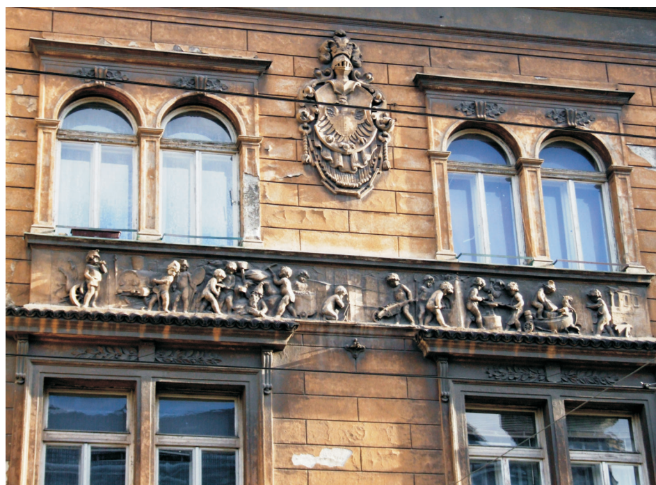
Bytový a obchodní dům; reliéfní vlys na němž se pohybují děti při výkonu zaměstnání dospělých. Vypravují vlak, dolují uhlí, taví železo, pracují jako kováři i stavitelé.