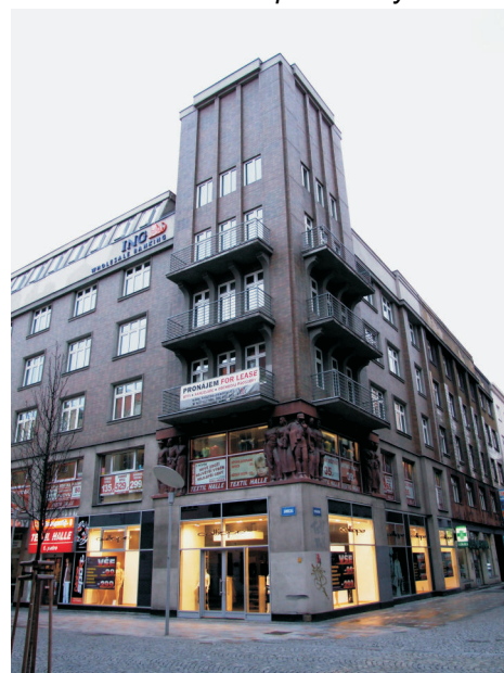
Palác pojišťovny Riunione Adriatica