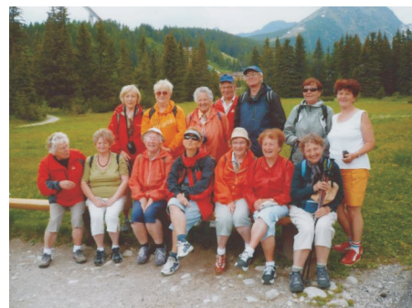
Vysoké Tatry - Štrbské pleso