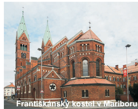
Františkánský kostel v Mariboru

Stará historická část Mariboru nabízí nezapomenutelné zážitky, bez jejichž prozkoumání by návštěva města byla jen poloviční. Stěžejními centrálními prostory Mariboru jsou Hlavní náměstí (Glavni trg) a Slomškovo náměstí (Slomškov trg). Na Hlavním náměstí se tyčí morový sloup. Toto umělecké dílo má připomínat někdejší tragédii ze 17. století, kdy celá třetina Mariborčanů zemřela na černou smrt.