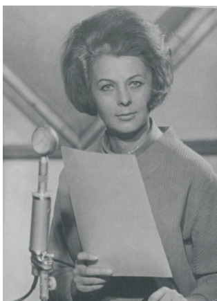
Březen 1968 ČT Ostrava