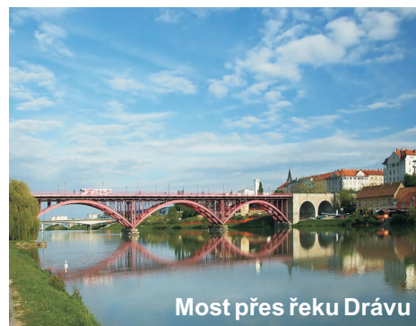
Most přes řeku Drávu

Maribor má něco málo přes 100 tis. obyvatel. Městem protéká řeka Dráva a je to město historické s dlouholetou vinařskou tradicí. Je tam nejstarší vinná réva, která má přes 400 let a je zapsaná v Guinnessově knize rekordů.