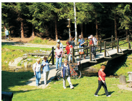
Vojenští důchodci při výletu do Zlatých Hor

Nezapomíná se na jubilanty, ani na setkání představitelů Krajského vojenského velitelství s důchodci, kteří dosáhli „kulatého“ životního jubilea, aby si s nimi pohovořili o jejich starostech a radostech a předali drobné dárečky. I tato pozornost je ze strany jubilantů vděčně přijímána. Výbor sekce spolupracuje s Českým rozhlasem Ostrava a jednotlivým jubilantům prostřednictvím