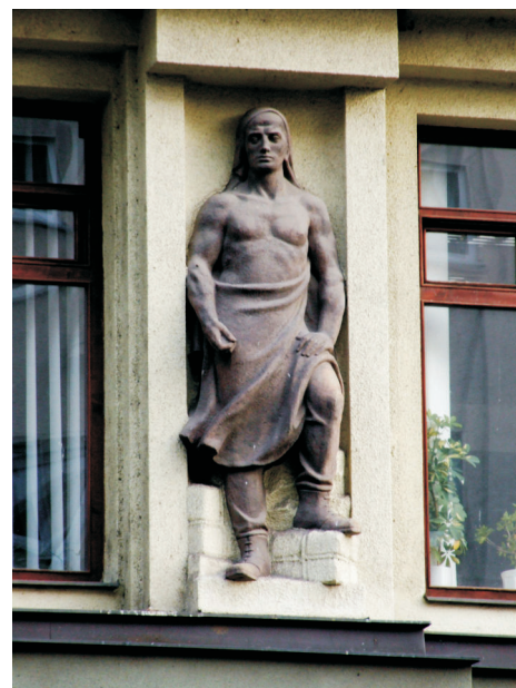
Česká průmyslová a obchodní banka, (reliéf Obchod)