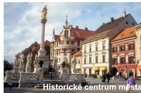
Historické centrum města

Maribor má něco málo přes 100 tis. obyvatel. Městem protéká řeka Dráva a je to město historické s dlouholetou vinařskou tradicí. Je tam nejstarší vinná réva, která má přes 400 let a je zapsaná v Guinnessově knize rekordů.