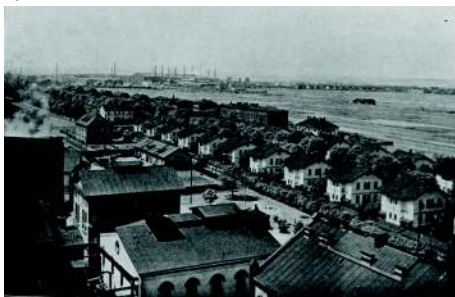
Dělnická osada jámy Hlubiny. Dělnické domy pro 4 rodiny.

V kolonii byla obecná škola, ve které je dnes ředitelství Městské policie a pro sportování hřiště DTJ.