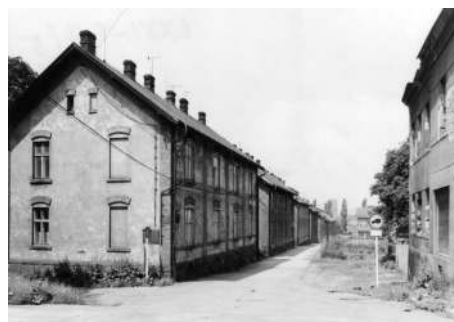
Kolonie Dolní - Mariánské Hory

Dolní kolonie - Mariánské Hory - byla vybudována v letech 1897-98. Měla 31 domů a tři dělnické ubytovny. Domy byly umístěny podél Rybářské ulice asi 1100 m od Dolu Jan Šverma. Velká část kolonie byla zbourána při výstavbě obchodních supermarketů.