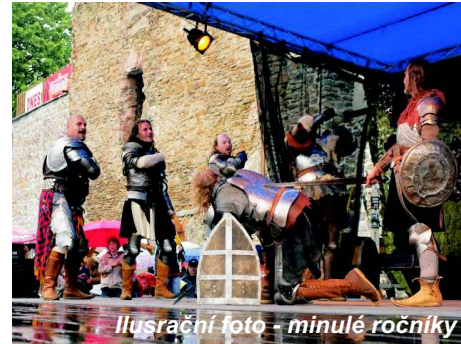
Ilustrační foto - minulé ročníky