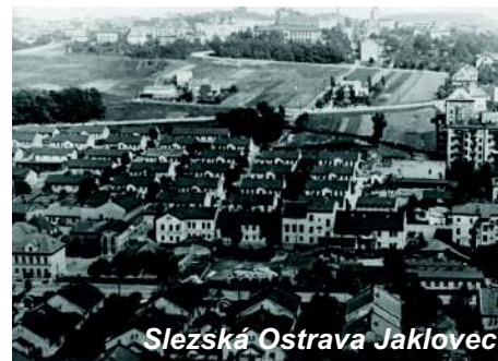
Slezská Ostrava Jaklovec

Kolonie Jaklovec - první domy jsou z roku 1860. Kolonie měla 37 domů vesměs přízemních. Dělnické byty měly pouze jednu obývací místnost a kuchyň. Kolem kolonie vedla úzkokolejná trať z Moravské Ostravy do Michálkovic. Velká část kolonie zanikla při výstavbě stadionu Baníku Ostrava a zbytek domů po výbuchu plynu na mostě Pionýrů v roce 1976.