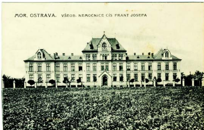
Čelní pohled na měst. nemocnici císaře Františka Josefa v Moravské Ostravě kolem roku 1900