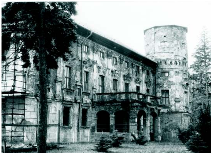
Zámecká budova před rekonstrukcí. Roku 2001 se stal zámek majetkem obce a postupně je opravován.

A kde se vlastně přesně zámek nachází? Uprostřed vsi Linhartovy na Bruntálsku.