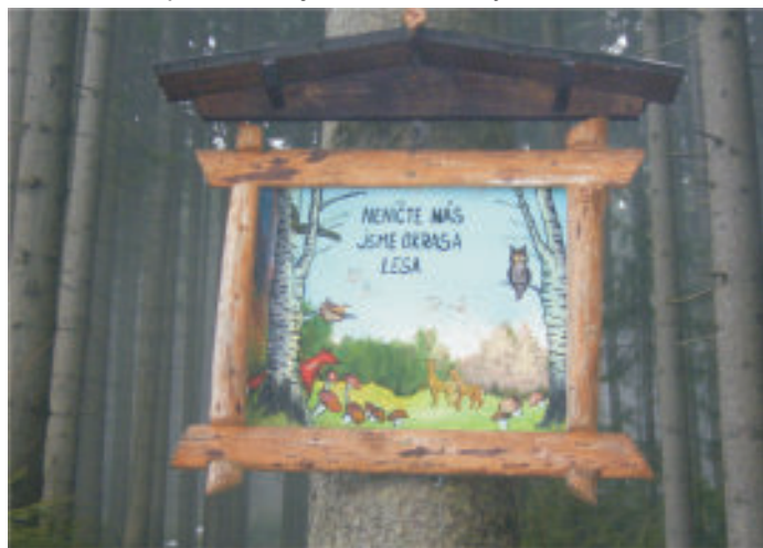
Jedna z tabulek: Neničte nás, jsme okrasa lesa

Osada Javořinka se nachází pod stejnojmenným vrchem Javořina (někdy uváděno jako Javořinka - 831 metrů n.m.), který nenápadně vystupuje nad středem osady. Nedaleko vrcholu v zalesněné části se nalézá malá skála vysoká (6 - 8 metrů), která je dokonce zařazena mezi lezecké terény, i když je navštěvována velmi zřídka. Část osady patří do katastrálního území obce Bílá a část do katastrálního území Ostravice II, spadajícího pod obec Staré Hamry. Přes osadu prochází modrá turistická značka z Bílé na Samčanku. Na bílanské části Javořinky se nachází rozcestník 720 metrů n.m. Na starohamerské části je šest chalup a na bílanské straně čtyři chalupy. Jižně od Javořinky se nalézá osada Mičulky a paseka Kosti. Na této pasece stávala v dávných dobách salaš. Jedné kruté zimy v ní zahynul bača i se svými ovečkami. Zbyly po nich jenom kosti, jak se praví v průvodním slovu k filmu o Starých Hamrech, který v 60. letech v době před zatopením údolí natočil hostinský pan František Duží. Severně od osady směrem na Samčanku v místech dnes zcela zalesněných bývala paseka Volňanka a pod příjezdovou cestou k osadě je samota Myslikovjanka s jedinou chalupou, kde žije rodina Borských.