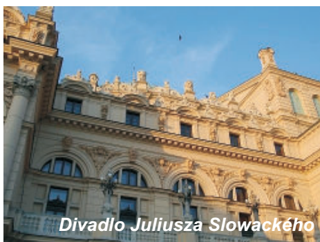
Divadlo Juliusza Słowackého

Univerzitní Krakov je metropolí Malopolského vojvodství. V minulosti byl více než pět set let hlavním městem Polského království. Když se v roce 1596 panovník přestěhoval do Varšavy, zůstal významným kulturním centrem země a také místem královských korunovačních pohřbů. Po třetím dělení Polska v 18. století, a až do roku 1918, patřil Krakov k rakousko-uherskému mocnářství.