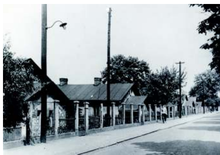
Stará kolonie Zárubek

Kolonie Hermenegild vznikla kolem roku 1850 a měla 24 domků. Kolonie Na Vilémce byla rovněž založena v roce 1850 a původně měla 45 přízemních domků. Kolonie Jakubská vznikla v roce 1860 a měla padesát domů.