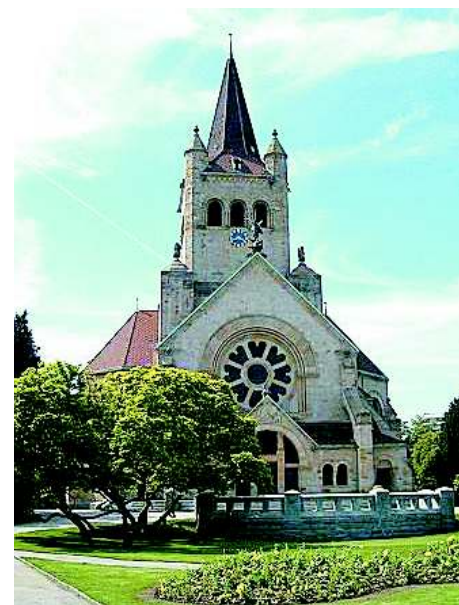
Chrám sv. Pavla

Basilej je místo jako stvořené pro pořádání knižních veletrhů: je to město knihtisku, vzdělanosti i oblíbený cíl návštěv mnoha světových umělců (ve výborném literárním průvodci po Švýcarsku " Malá země s velkými příběhy " od Jiřího Kamena je proto Basileji právem věnován velký prostor). Vynikající kvalita basilejského papíru pak byla jedním z důvodů, proč se do Basileje po vynálezu knihtisku přestěhovalo mnoho tiskařů – dodnes mají v Basileji muzeum výroby papíru. V továrně na papír (Papiermühle) si můžete sami vyzkoušet vyrobit svůj list papíru. Toto muzeum dostalo kdysi dokonce vyznamenání jako nejlepší muzeum v Evropě.