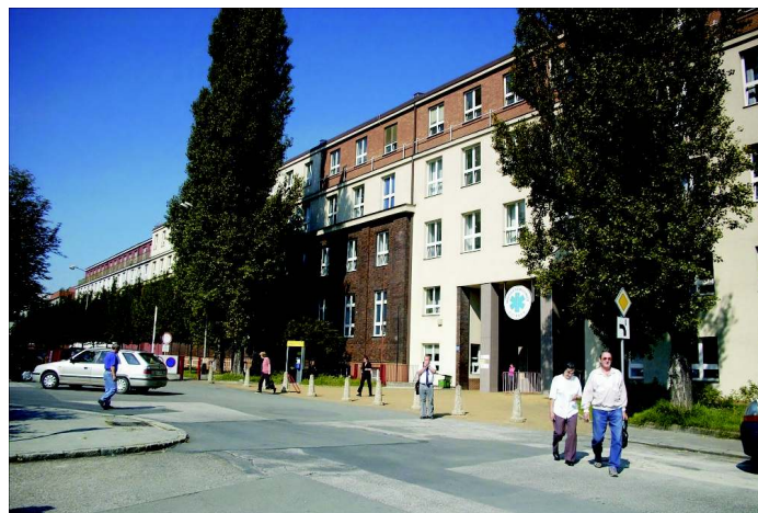
Městská nemocnice v Ostravě

V posledních desetiletích se značně prodloužila průměrná délka života i nemocnost populace a tak má Městská nemocnice, která pro svou polohu patří mezi nemocnice regionální, mnoho "svých" pacientů a proto má také velký podíl opakovaných hospitalizací, zejména chronicky nemocných pacientů z řad seniorů. Současný starší člověk mívá obvykle kromě zdravotních i své vlastní sociální problémy. A tak velmi často zdravotnický personál řeší současně se zdravotnickou problematikou i otázky sociální, což vedlo k tomu, že byl v naší nemocnici zaveden institut tzv. "sociální hospitalizace" s kapacitou 24 lůžek. Jako další zlepšení pro řešení zdravotně-sociálních situací našich spoluobčanů jsme v dubnu 2007, spolu s Odborem sociálních věcí a zdravotnictvím Magistrátu města Ostravy, otevřeli Dům sociálních služeb s kapacitou 66 lůžek. Je však třeba vědět, že i v tomto zdravotně-sociálním zařízení je délka pobytu limitována 6ti měsíci a není tedy definitivním řešením pro ty, kteří potřebují lůžkový pobyt v sociálním zařízení na dobu trvalou.