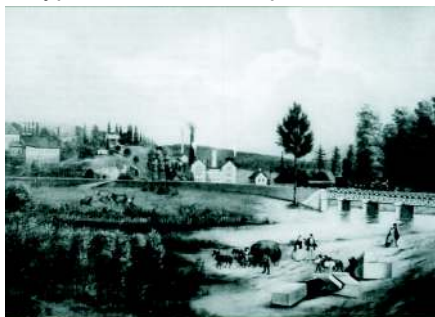
Pohled na důl Hermenegild na Zárubku z r. 1862.

Dne 14. 4. 1990 vznikl v ochranném piliři sloje Hugo požár, který se nepodařilo zlikvidovat. Proto dne 15. 4. 1990 byl celý Důl Zárubek uzavřen. Těžní jáma byla postupně do února 1993 zasypána v úseku od 2. patra až dolů.