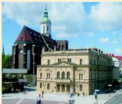
Slezské divadlo v Opavě

Pohádka pro dospělé o lásce a vděčnosti, ale i lidské závisti a nenasytosti - to je japonská národní opera Yuzuru. V české i evropské premiéře v podání nejaponských umělců ji uvedlo Slezské divadlo v Opavě.