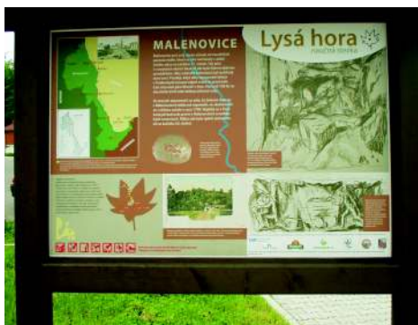
Začátek trasy - naučná stezka Lysá hora - Malenovice

V našem tipu na výlet vás zavedeme na jednu z nejhezčích tras v Beskydech. Projdeme se po části naučné stezky (NS) na Lysou horu, kterou provozuje Správa CHKO Beskydy. Vyrazit na ní lze ze dvou míst. Od nádraží z Ostravice a od parkoviště u Rajské boudy v Malenovicích (po žluté turistické značce), my jedeme autobusem do Malenovic a vystoupíme na točně - na parkovišti u stylové restaurace Rajská bouda.