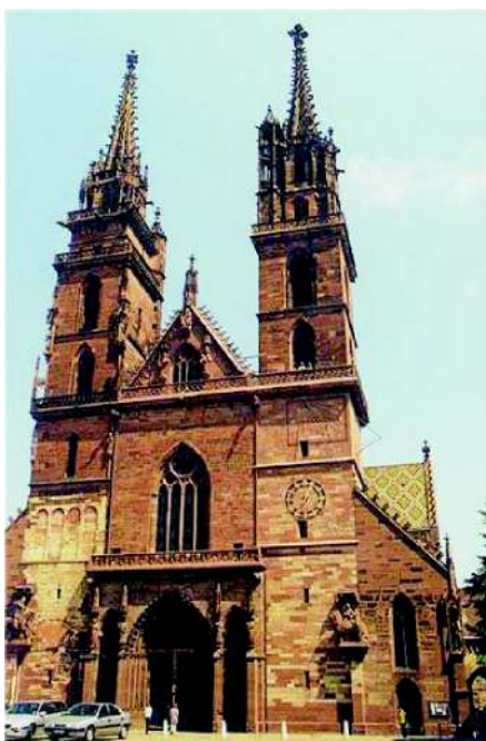
Katedrála v Basileji

Obdobná fontána (méně barev, ale důmyslnější pohyby) je také v Basileji před městským divadlem.