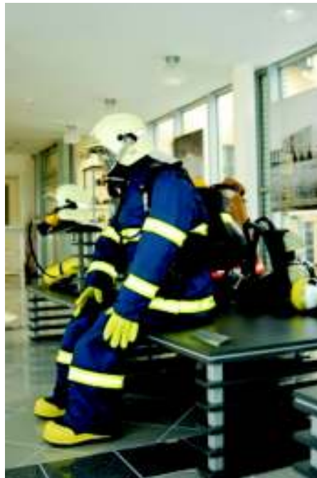
Jeden z exponátů

Problém nastal až v okamžiku, kdy se mu roztavila automatika u dýchacího přístroje. Naštěstí se dostal ven," zdůrazňuje při prohlídce průvodce.