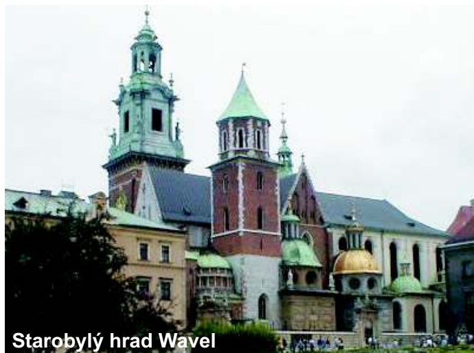
Starobylý hrad Wavel

Pojďme dále na procházku Krakovem. Hned na první pohled nás zaujme hrad Wavel, majestátně se tyčící nad řekou Vislou. Wavel býval sídlem polských králů až do sedmnáctého století. Velkolepý hrad s 71 různými komnatami a místnostmi získal svůj renesanční charakter v letech 1502-1536. V jeho architektuře však lze nalézt také mnoho gotických prvků.