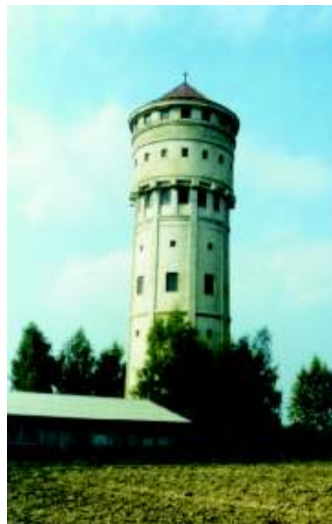
Původní věžový vodojem v Karviné dnes již vodárenským účelům neslouží

Po rozšíření a propojení celé soustavy je v současnosti voda do Karviné přiváděna i z beskydské strany OOV. Dostatečná kapacita kvalitní pitné vody, která splňuje přísná jakostní kritéria stanovená v direktivě rady Evropy č. 98/83/EC, umožňuje od roku 2001 dodávat vodu i přes hranice do Polska. Z Petrovic u Karviné plyne voda do stotisícového města Jastrzębie Zdrój ležícího asi 15 km na sever od Karviné.