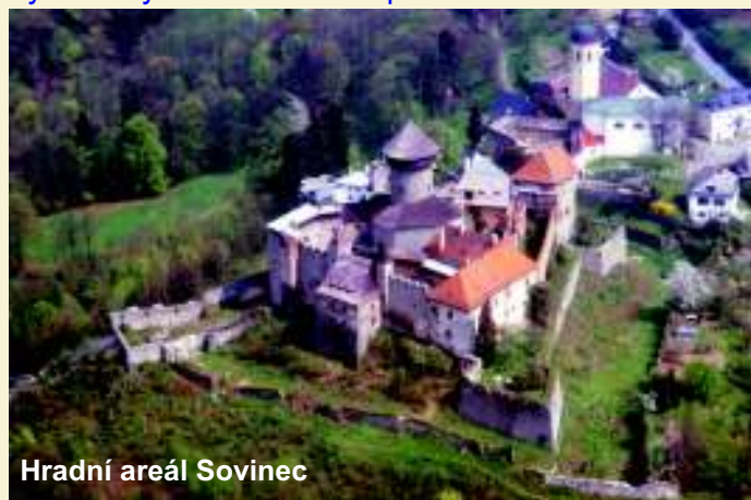
Hradní areál Sovinec

Třináct kilometrů na jih od Rýmařova na okraji masivu Nízkého Jeseníku se nachází hrad Sovinec a stejnojmenné městečko. Při prohlídce starobylého hradu možná narazíte na zdejší bílou paní, nebo vás třeba budou chtít oloupit loupežníci. Ale nebojte se, nic se vám nestane, jen budete bohatší o pěknou vzpomínku. A nejen, že zažijete dobrodružství, ale z věže Horního hradu se naskytne překrásný výhled do krajiny sovineckého přírodního parku. Rozsáhlý hradní areál byl založen koncem 13. století a během staletí byl několikrát přestavován a rozšiřován. Později byl v rukou Řádu německých rytířů a sloužil jako řádový seminář, lesnická škola, muzeum a letní sídlo velmistra. V roce 1939 byl Řád Německou říší zrušen a proměněn na zajatecký tábor. Na samém konci války byl hrad vydrancován a zapálen.