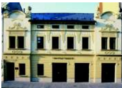
Budova Hasičského muzea

Modlit se či hasit? To byl problém, který lidé řešili před staletími. Když zjistili, že modlitby ke svatému Floriánovi či jiným svatým nepomáhají, vznikly první hasičské sbory. Tak počátky tohoto řemesla popisuje s úsměvem správce Hasičského muzea v Ostravě-Přívoze, které bylo otevřeno v květnu 2005.