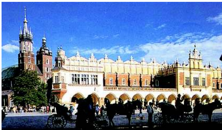
Sukiennice - na svou dobu velmi rozsáhlá budova, tržnice, ve které se neprodávalo jen sukno

Jedním z nejstarších exponátů hradu je zoubkovaný meč polských králů (szczyrbiec), který byl používán při korunovačních ceremoniálech. V areálu hradu se nachází rovněž neméně slavná katedrála. Ve věži katedrály je umístěn největší polský zvon sv. Zikmund, vážící jedenáct tun, kterému v roce 2000 puklo srdce. V současné době je již zvon opraven a tak opět může poutníkům připomínat běh času.