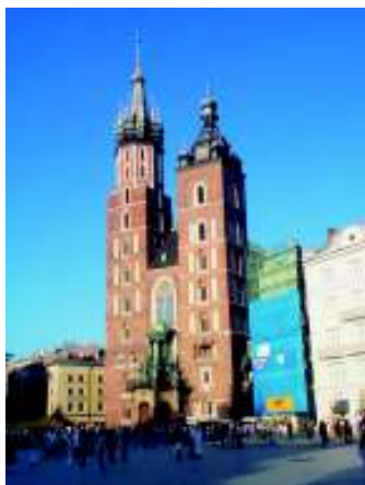
Kostel Panny Marie

V navštívení se vydáme k našim severním sousedům. Navštívíme Krakov, který je čtvrtým největším městem v Polsku. Žije zde zhruba necelý milion obyvatel. Město leží na řece Visle. Do Krakova se dá pohodlně dojet autem nebo vlakem. Krakov svou architekturou a starobylou atmosférou v mnohém připomíná Prahu. Však také byl společně s Prahou a dalšími evropskými městy zvolen Evropským městem kultury. Téměř čtvrtina polských muzeí se nachází v Krakově a zde se také nachází jedna z nejznámějších obrazáren ve střední Evropě - Muzeum Czartoryskich, kde je rozsáhlá sbírka uměleckých děl ze starého Řecka a Egypta, dále orientální artefakty, zbraně a koberce, a rovněž sbírka evropských obrazů a soch od 13. do 18. století. Můžete zde nalézt takové skvosty jako Dáma s hranostajem od Leonarda da Vinciho nebo Rembrandtův obraz Krajina s dobrým Samaritánem.