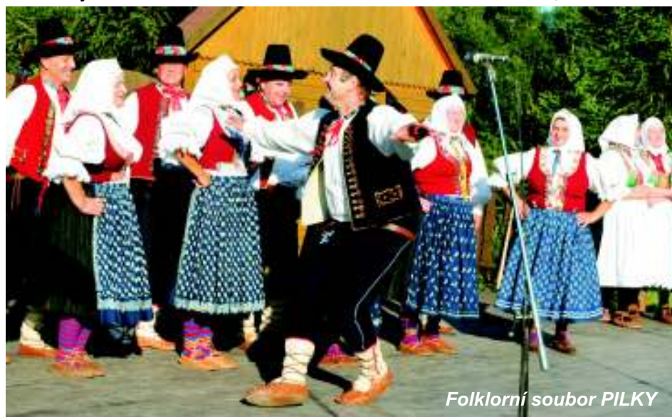
Folklorní soubor PILKY

(Program národopisných slavností - viz pokrač. na straně 8)