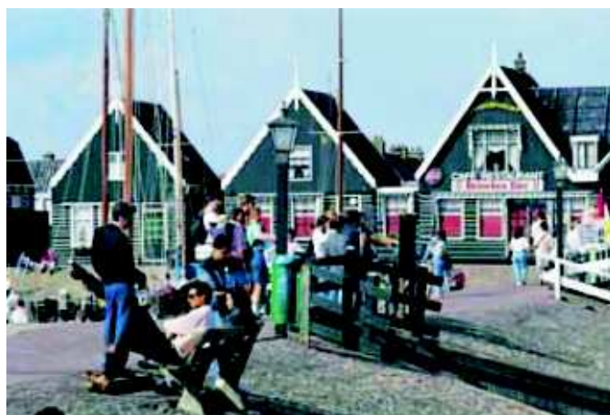
Obrázek z Holandska