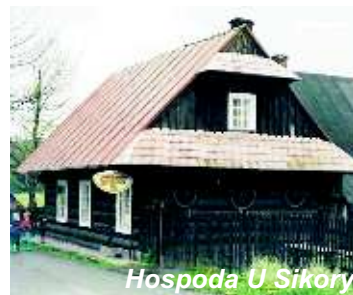
Hospoda U Sikory

Tip na výlet vybrala z veřejně dostupných informací Miluše Enenklová