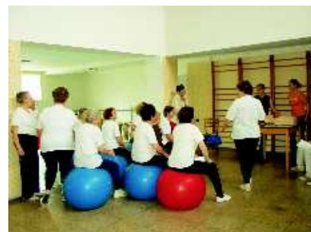
▲ Zajímavé byly i ukázky první pomoci - umělé dýchání na cvičném modelu.

Rádi bychom z tohoto sportování udělali tradici a v příštím roce se potkali při zápolení na regionální úrovni. Již teď tedy můžete přemýšlet v jaké disciplíně se