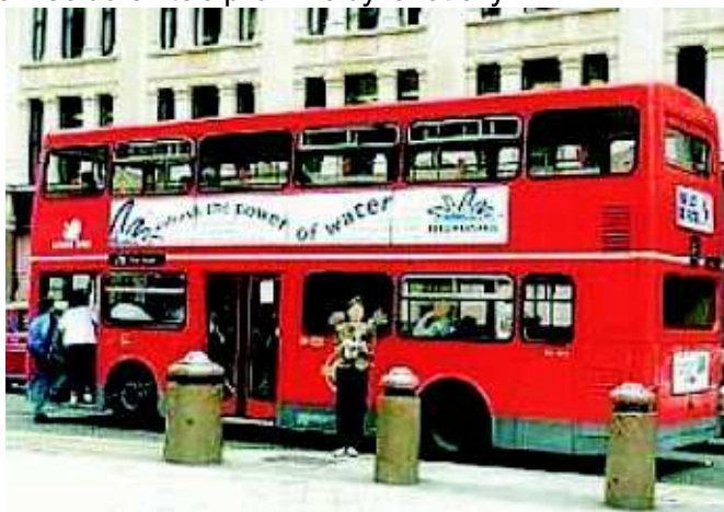
Londýn - Double-decker bus

Londýňané sice nadávají, že jejich autobusová doprava je nejhorší na světě, ale protože mé povědomí o londýnských autobusech nebylo velké to, co mne čekalo mi připadalo jako zázrak. Síť autobusových linek pokrývá v podstatě celý Londýn. Nastoupila jsem do dvouposchodového autobusu a na ten jsem se docela těšila. Přivítal mě usměvavý černošský řidič, rádio řvalo a on si pokuřoval. Pohoda, paráda. Dívala jsem se, kde mám označit jízdenku, syn však pravil: "Klidně se posad, přijde průvodčí". A přišel. Hrál opětovně všemi barvami, tvářil se důležitě a pro mne byl exotický.