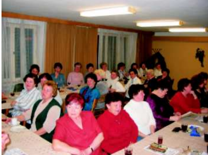
"Haviřovské babky" zpestřily oslavu MDŽ členkám Šenovského Sokolu

V kronice mám zapsáno 595 vystoupení. A kde? Kromě našeho města či okresu to bylo například ve Svitavách, Kroměříži, Hranicích, Přerově, na Kunětické Hoře, několikrát v Praze (i v Parlamentu ČR), Lázních Jeseník, Karlově Studánce, Klimkovicích, ale také na Slovensku, v Polsku. Zúčastnily jsme se také mezinárodní přehlídky ve Frýdku-Místku a v Č. Těšíně.