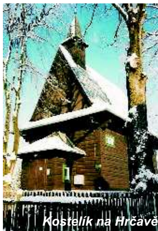
Kostelík na Hrčavě

Historie hrčavského kostelíku je nerozlučně spjata s historií Hrčavy. První zmínka o Hrčavě pochází z roku 1645 v souvislosti s budováním řetězce šancí a dalších obranných zařízení, která měla sloužit k obraně Těšínska proti vpádu Turků z Uher. Samostatnou obcí se stala 6. října 1927. Nejbližší římskokatolickou farností byl pro obyvatele Hrčavy asi 12 km vzdálený Jablunkov, kde pochovávali i své blízké. Protože na Hrčavu nevedla z nejbližší obce těšínského regionu Bukovce silnice, ale jen lesní a polní cesty, pohřbívání v Jablunkově, zvláště v zimě, kdy Hrčava bývala i delší dobu odříznuta od světa, bylo hodně svízelné. Proto se rozhodli postavit si vlastní kostelík. Stavět se začalo v březnu a svěcení kostelíka se uskutečnilo 5. července 1936. Byl zasvěcen věrozvěstům Cyrilu a Metoději.