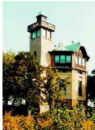
Vodárna na Slezské

V krátkých vizitkách vám představujeme několik městských obvodů. Malebnější sídlo úřadu městského obvodu byste těžko hledali.