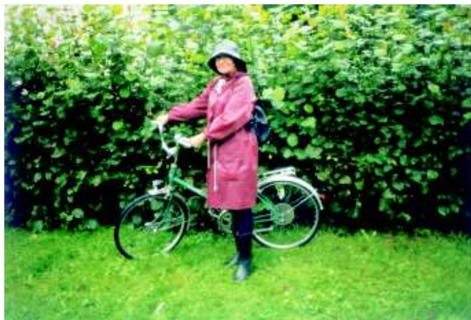
Ještě se usmívám, jedu pro kapustu...

Rozloučila jsem se v duchu s kapustou a šla jsem omladinu vyprovodit. Co jiného se mohlo stát, než že začalo pršet a spustily se i kroupy. Snažily jsme se s dcerou a dětmi zachránit útekem pod střechu na autobusovou zastávku. A při tom „úprku“ se utrhl kšanda od bažůžku a ten spadl na zem i s kapustou. Když jsme byli všichni pod střechou na zastávce, pronesla dcera varovným tónem: „Já cítím kapustu“. S mírně vzrůstající hladinou adrenalinu jsem otevřela zavazadlo. Za neskrývaného zájmu dalších deseti lidí, schovaných před deštěm, jsem začala věci z bažůžku vytahovat. Dětské svetříky, obrázková knížka, papučky a kloboučky byly naplněny kapustou. Ta zase naopak byla plná střepů z rozbité sklenice. Za asistence všech kolem stojících jsem v šíleném lijáku, teď už ne opatrně přemístila, ale doslova a do písmene vykydala kapustu na trávník u zastávky. Maně jsem si vzpomněla na oblíbený výrok mého muže, že některé nevhledně upravené jídlo vypadá jak psí blití. Kapusta na trávníku tak vypadala. A pro dovršení té dramatické chvíle řekl můj vnuk do šumění deště velmi lítostivým tónem, který nebezpečně připomínal dítě týrané hladem: „Ale co budeme mít zítra k obědu?“