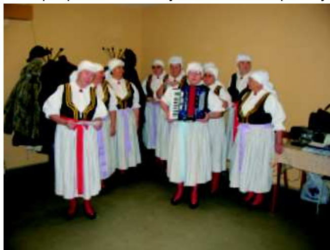
Folklorní soubor "Haviřovské babky"

Díky pochopení vedení našeho města jsme dostaly finanční příspěvek z něhož jsme si oblečení pořídily.