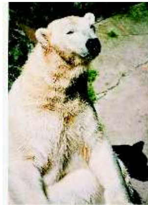
Obrázek ze ZOO