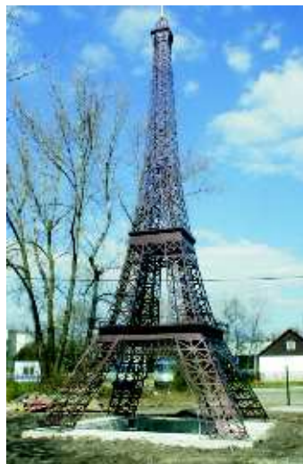
▲ Paříž se svým nezapomenutelným symbolem TOUR EIFFEL

Nebojte se, nebude to velké cestování. Dokonce nemusíte utrácet tisíce korun či Eur. Evropu jako na dlani máte k dispozici na Černé louce v Ostravě.