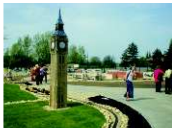
▲ Věž se zvonem Big Ben , jeden z nejznámějších symbolů Londýna i celé Británie. Údery zvonů jako časové znamení znají také posluchači rozhlasové stanice BBC po celém světě.

Prohlídku významných evropských staveb vám nabízí projekt miniměstečka MINIUNI.