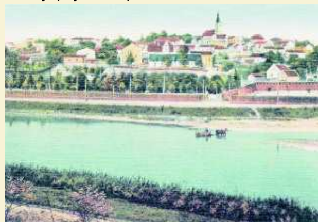
Pohled na Slezskou Ostravu - obrázek pana Tejkala

Od 14. května je v tomto obvodu také otevřena jedinečná historická památka Slezskoostravský hrad. Zároveň s ním byla otevřena a pokřtěna lávka přes Ostravici, která z centra Moravské Ostravy umožňuje příjemnou procházku až na hrad.