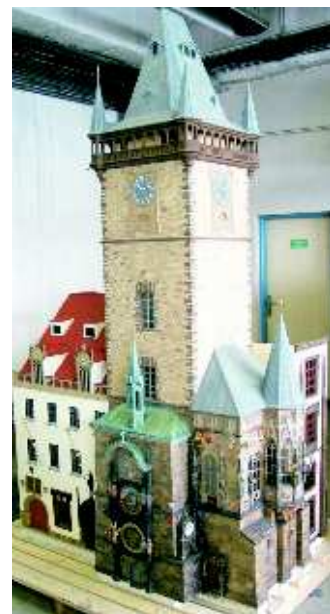
▲ Staroměstská radnice patří k nejvýznamnějším středověkým památkám historického centra Prahy.

Pro děti jsou v provozu další atrakce. Dřevěné prolézačky a houpáčky, nafukovací a hrací objekty.