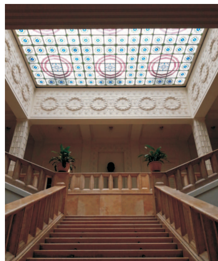
Hlavní schodiště v ústřední patrové hale pod střešním světlíkem

Oproti přísnému akademickému programu zvládnout vysokou architekturu na základě studia i reprodukce historizujících forem získal právě tam vzhled i do nastupující secese a navíc