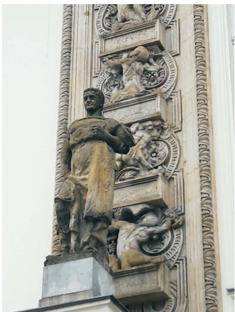
Alegorie Kovářství (asi), pískovcová socha (J. Obeth)

Ve výše zmíněném čase, roku 1850, byla na podporu obchodu, průmyslu a živností zřízena Obchodní a živnostenská komora. Jakoby paradoxně, musela vyklidit své působiště z uměleckoprůmyslového muzea (dnes Slezské zemské muzeum), jehož vznik sama iniciovala, a postarat se o vlastní sídlo. K tomu