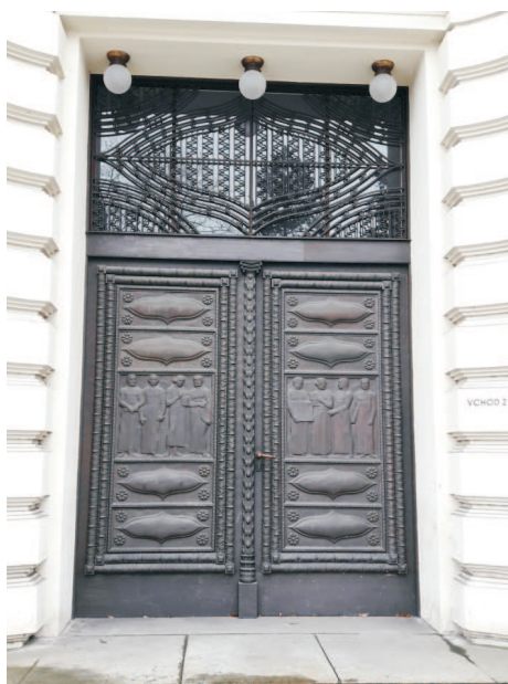
Dveře hlavního vstupu s figurálními reliéfy, Alegorie fyzické a duševní práce

povolala architekta s tehdy již značným renomé, Leopolda Bauera. Šlo o rodáka z blízkého Krnova, pocházejícího z rodu znalého širšího evropského podnikatelského prostoru, ale také rodu se silným kulturním uvědoměním. Na vyšší průmyslové škole v Brně se v 80. letech 19. století setkal s Josefem Hoffmannem, Adolfem Loosem a dalšími později proslavenými architekty. Stavitelem praxí prošel v Toruni a Düsseldorfu, než se roku 1892 zapsal na vídeňskou Akademii výtvarných umění a tam po krátké době zakotvil v ateliéru slavného architekta a urbanisty Otto Wagnera.