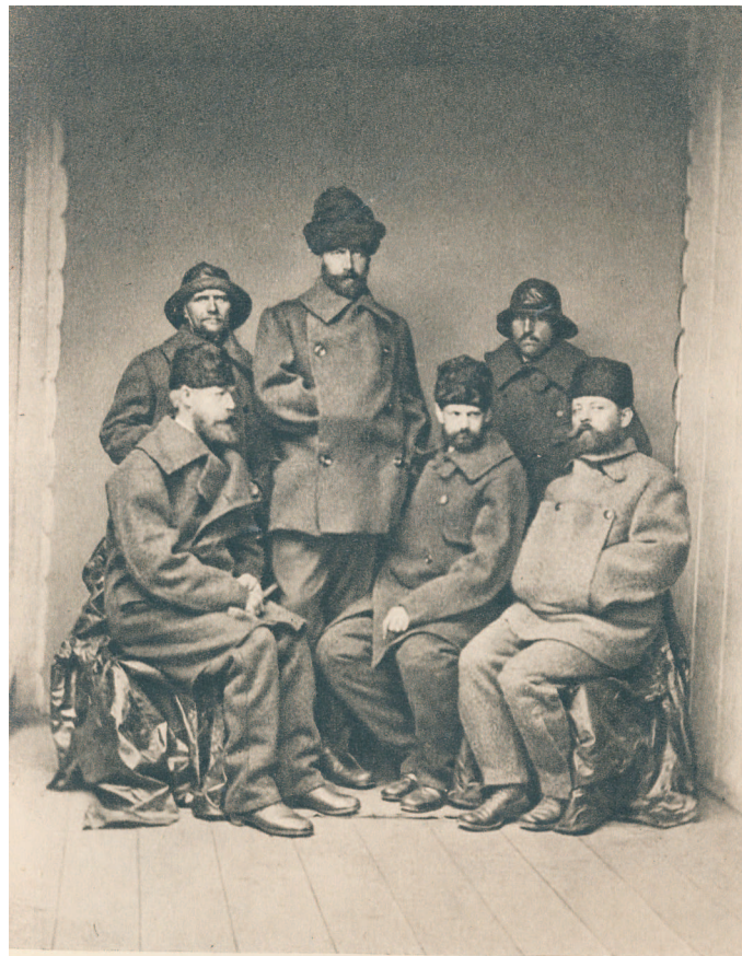
AUF DER ERSTEN POLAREXPEDITION (1872).