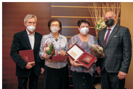
Ocenění seniorů roku 2021