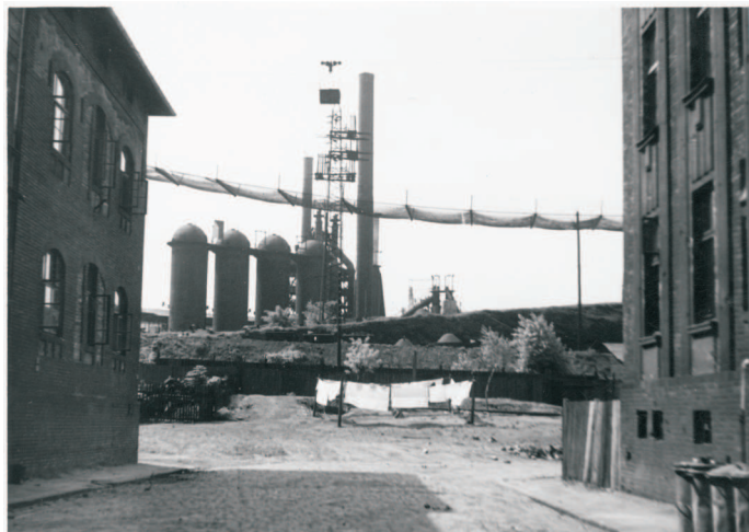
Pohled na Žofínskou huť z Žofínské ulici v 50. letech 20. století.