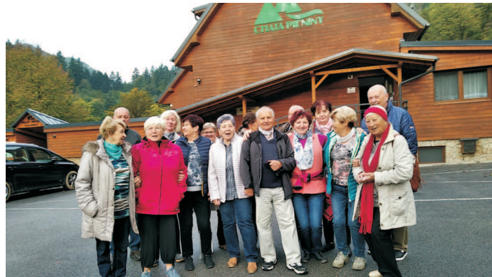
↑ Senioři z Klubu učitelů Havířov Goralské plťe na řece Dunajci (ilustrační foto) ↓