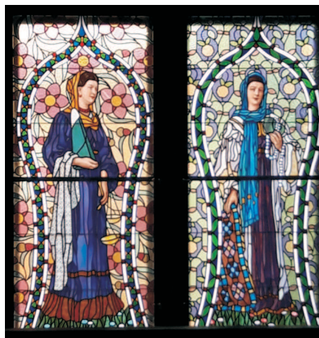
Detail vitraille ze slavnostního sálu, Alegorie lidských dovedností (A. Zdrázila)

Architekt však původní verzi zásadně změnil. Stavbu sevřel kolem patrové haly se širokým schodištěm a prosvětlené barevným střešním světlikem. Podařilo se mu vyvážit hmotu, linie i dekor, stejně jako reprezentativnost s účelností. V základních pohledech je stavba symetrická a tam, kde je zapotřebí řešit vnitřní prostory účelně, volí nenápadnou asymetrii. V mohutném hlavním bloku jsou umístěny reprezentativní a zasedací místnosti, navazující křídla sloužila administrativě. Na promyšlenou koncepci kompoziční se váže symbolika, zdůrazňující - a zřejmě i uspokojující - podnikatelské sebevědomí, jemuž měla komora sloužit. Vně i uvnitř. Na čelních pilastrech vysokého řádu, jež ohraničují okna slavnostního sálu, jsou v rytmicky osazených reliéfech reprezentována slezská města, na zvýrazněném kladí představených sloupů figurují alegorie řemesel v podobě nadživotních mužských postav. Sochařské práce obstaral Josef Obeth. Monumentalitu a vzrůsnost celku uzavírá mansardová střecha, do níž jsou zasazeny tři vikýře jakožto vyvýšení oken dvoupatrového hlavního sálu.