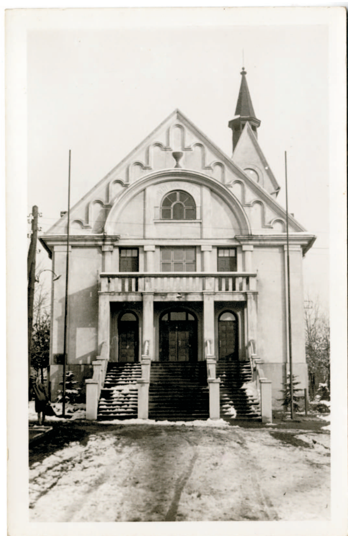
Husův sbor čs. církve husitské v Radvanicích nedlouho po slavnostním otevření 13. září 1925

2. února 1970 v Praze zemřel dirigent, skladatel, hudební vědec Jaroslav Vogel (narodil se 11. ledna 1894 v Plzni). Po návratu z vojenské služby v 1. světové válce působil v Ostravě v letech 1919–1923 jako kapelník opery Národního divadla moravskoslezského. V roce 1927 se do Ostravy vrátil a stal se na 16 divadelních sezon šéfem opery. Zde se mu podařilo vybudovat velmi osobité středisko hudební kultury s vysoce kvalitním operním souborem. Pozoruhodná dramaturgie byla zaměřena jednak na české klasiky i současné autory, jednak na světový repertoár s R. Wagnerem, R. Straussem a ruskými skladateli. Projevil se též jako jedna z nejvýraznějších organizátorských osobností ostravského kulturního života. Podílel se na činnosti Kruhu přátel vážné hudby, v roce 1934 byl spoluzakladatelem Spolku pro komorní hudbu v Moravské Ostravě. Potřetí se Vogel vrátil do Ostravy v letech 1947–1948.