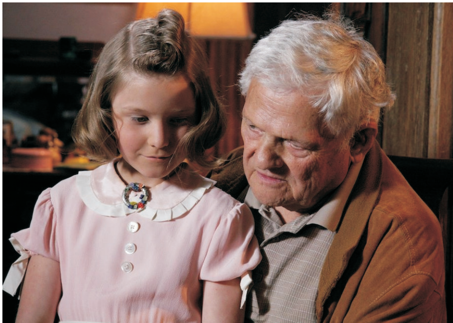
Hanin kufřík - silný příběh dvou dětí, které vyrostly v předválečném Československu byl i zfilmován. Více na: http://www.infilm.cz/cs/filmy/hanin-kufrik.html .

ale přikládají ze své rozsáhlé sbírky 4500 dětských kreseb pět fotografií obrázků, které nakreslila Hana Brady za svého pobytu v Terezíně. Když byly fotografie kreseb vystaveny v muzeu vedle kufříku, zájem návštěvníků o osobní příběh Hany Brady byl ještě větší. A tak Fumiko pátrala dál. V červnu 2000 napsala znovu do muzea v Terezíně. Odtud ale potvrdili své předchozí sdělení, že o samotné Haně Brady nic nevědí.