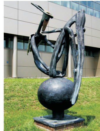
Jindřich Wielgus - Stéla Jaromír Gargulák - Myslitel

Na Studentské ulici můžete využít městskou dopravu, nebo se vrátit okružem zpět na výchozí bod trasy. Kousek níž na obvodu areálu VŠB před novou aulou balancuje na kouli bronzová postava Myslitele . Je časově posledním sochařským opusem souvisejícím s porubskou akademickou zónou, na plintu (základové desce) datován 2006 a signován JG, což znamená autorství Jaromíra Garguláka . A schválně: dojdete-li až k Mysliteli , zamyslete se nad jeho podobou i pojmenováním. Třeba najdete souvislosti nejen v předminulém století ve Francii, ale i v jedné kovářské dílně na Valašsku. Pokud ne, literatura nebo Google určitě prozradí.