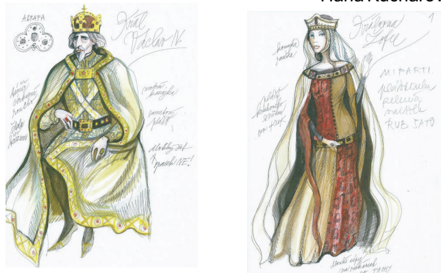
Kostýmní návrhy k filmu "Jan Hus".