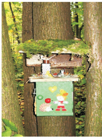
Keš ze starého PC, malé divadlo, lesní domeček atd. Radost máme z každé nalezené keše.