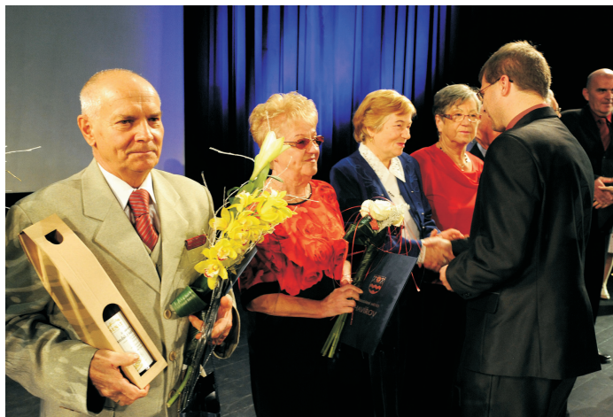
Ocenění senioři u příležitosti oslav.