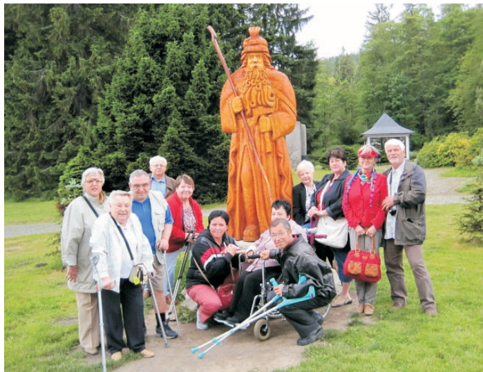
Havířovští senioři Na výletě v Karlové Studánce.