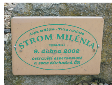
Tabulka u Stromu milénia.

Vysazené stromy se mají čile k světu. Bohužel po kácení starých stromů v okolí v lednu 2015, je jedna lípa poškozena a rovněž zmizela smaltovaná tabulka s nápisem upozorňujícím na to, že strom vysadili studenti gymnázia.