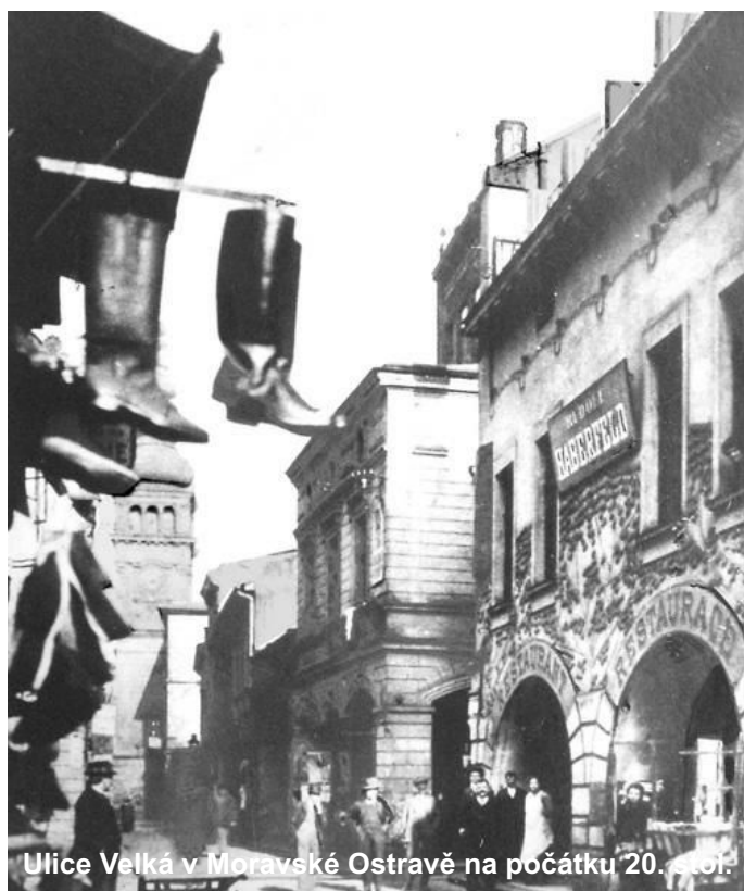
Ulice Velká v Moravské Ostravě na počátku 20. století.

Nedaleko radnice bují prostituce. V putyce U Ojczyzny nebo Port Arturu obsluhují číšnice, jejichž hlavním výdělkem není ani pevný plat, ani zpropitné, nýbrž prodávání těla. Mimo to jsou při tom hosté, kteří do těch bláhů zapadnou, nejrafinovanějším způsobem okrádání.“