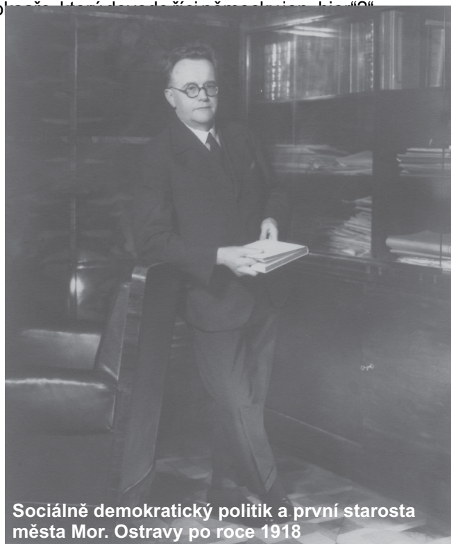
Sociálně demokratický politik a první starosta města Mor. Ostravy po roce 1918

10. ledna 1911 na schůzi obecního zastupitelstva Mor. Ostravy odsouhlaseno, že bude zvýšena obecní daň ze psů, z velkých se mělo ročně platit 30 K, z honičích 20 K a z malých psů 10 K. Delší debata nastala při projednávání ustanovení o prodeji potravin. „Konečně se naše radnice v zájmu obecního zastupitelstva rozhodla k přesnější kontrole a vydala v tom smyslu vyhlášku. Tato zdůrazňuje udržování čistoty všech potravin, které přijdou na trh. Tak nesmějí být např. pokládány potraviny, nevyjímaje ani ovoce, bez podložky na zem, aby se od ní neznečistily. Potraviny mají být pokud možno tak vysoko nad zemí k prodeji vyloženy, aby se k nim psi nedostali. Také má být podrobeno zkoumání veškeré mléko, zda-li není ředěno vodou.“ Dále se jednalo o opatření proti dlouhým jehlicím v dámských kloboucích. Aby zabráněna byla možnost zranění jehlicí vyčnívající z dámského klobouku, vydá obec nařízení, aby hroty na jehlicích byly opatřeny bezpečnostními kapslemi. Neuposlechnutí tohoto nařízení se stíhalo pokutou 20 korun.