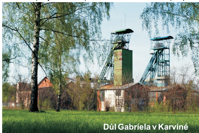
Důl Gabriela v Karvině

13. března 1911 večer vypukl na Dole Gabriela v Karvině požár. Vznikl nepozorností na jednom z lešení postaveném na pátém patře kvůli větším opravám. Rychle se šířil a způsobil i menší výbuch. Osazenstvo šachty muselo vyfárat, a protože obvyklé hasební prostředky selhaly, bylo rozhodnuto pátý horizont (v hloubce asi 300 metrů) zaplavit.