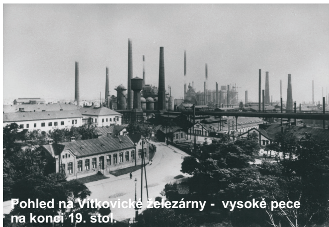
Pohled na Vítkovické železářny - vysoké pece na konci 19. století.