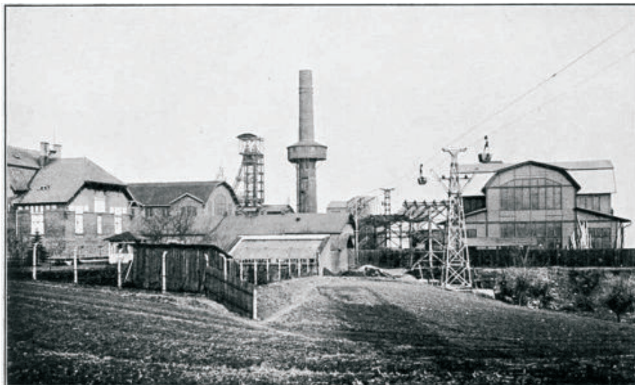
Abb. 19. Ida-Schacht in Hrušov.