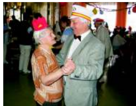
Atmosféra byla výborná a všichni se dobře bavili

Největším překvapením bálu však bylo pro klienty uzené selátko, na kterém si všichni pochutnali.