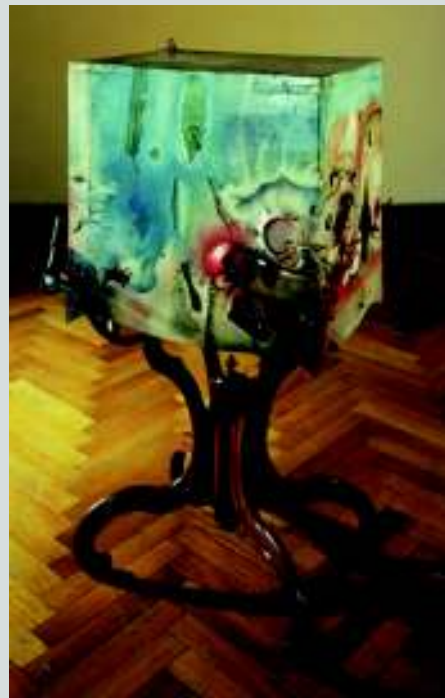
Bedřich Dlouhý, Objekt, 1963, kombinovaná technika

Šedesátá léta představují pro české výtvarné umění období obrody, nastupující již na přelomu předchozího desetiletí, které bylo dobou výrazného ideologického umrtvení a ztrátou kontinuity. Postupná rehabilitace tradice moderního umění umožnila proměnu názorů řady umělců střední a mladé generace, kteří se vydali cestou hledání autentických řešení, korespondujících s duchem evropského vývoje. Rozhodujícím nositelem nového myšlení se staly kolektivní výstavy mladých umělců skupiny Máj 57, Mladí z UB a Trasa .