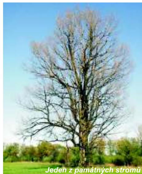
Jeden z památných stromů

Další zastavení je u mlýna, který nadchne především milovníky technických památek. Zdejší soustava vodních děl začala vznikat už koncem 15. století. V roce 1933 byla do mlýna zabudována Francisova turbína, navržená v roce 1849. Jeho palečné kolo s dřevěnými habrovými zuby převádí energii dodnes. Na poslední zastávce naučné stezky se dozvíte informace o místním rybníkářství a potom se vrátíte zpět do obce. (hol)