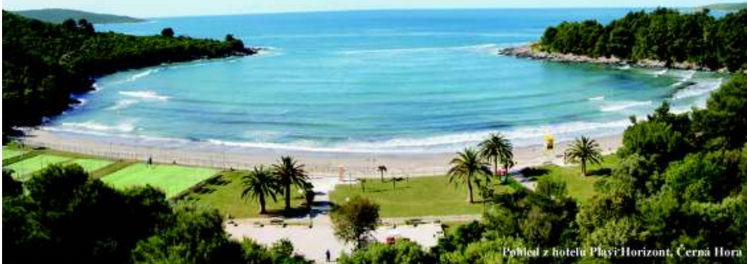
Pohled z hotelu Plavi Horizont, Černá Hora