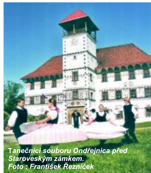
Tanečníci souboru Ondřejnica před Staroveským zámkem.

S vervou jí vlastní se vrhla na místní kulturu a založila zde na škole národopisný soubor. Zkušenosti již měla z Bělanu a úspěch se dostavil. V roce 1977 vyslala škola soubor na soutěže, děti pro něj vymyslely jméno a Ondřejnica byla na světě a letos má třicet let.