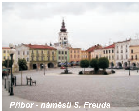
Příbor - náměstí S. Freuda

- Pamětní síň Sigmunda Freuda v Příborském muzeu, kde se můžete seznámit se základními údaji.