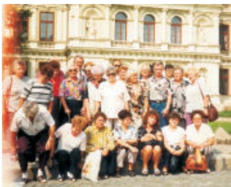
Členky Clubu na jednom ze zájezdů.

Slavíme společně i narozeniny, nejvíc ty kulaté a půlkulaté, ale třeba i narození vnoučat.