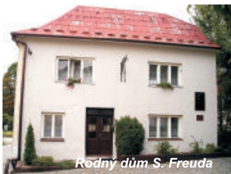
Rodný dům S. Freuda