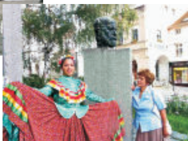
Pomník → Sigmunda Freuda