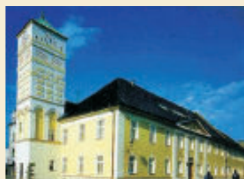
Radniční věž ▲

Město Karviná má bohatou historii. Význam města předurčovala jeho strategicky výhodná poloha na obchodní cestě z Uher do Pobaltí, která z něj učinila obchodní, hospodářské a kulturní centrum. První písemné zmínky o městě jsou z roku 1268. K velkému hospodářskému rozvoji došlo od pol. 15. stol., kdy bylo městu uděleno dědičné právo "do čtvrtého kolena", právo milové, várečné, právo lovu na panském, možnost zřizování cechů a právo vyššího soudnictví. Další rozkvět města zajistilo Kazimírovo privilegium z roku 1437, kterým byly potvrzeny dosavadní výsady města a povoleno pořádání trhů. V roce 1540 se poprvé objevuje zmínka o zřízení školy ve Fryštátě.