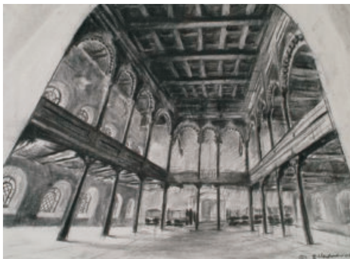
Sefardský strop synagogy v kresbě R. Neupauera

Synagoga byla dokončena opravou obou věží z prostředků Federace židovských obcí, Českoněmeckého fondu budoucnosti, Moravskoslezského kraje a města Krnova ▼