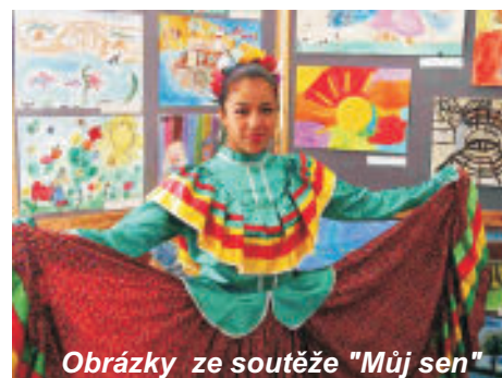
Obrázky ze soutěže "Můj sen"