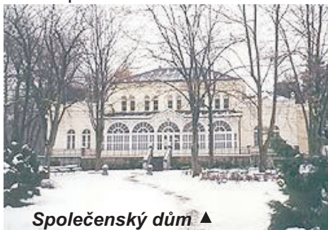
Společenský dům ▲

Lázně Darkov (staré lázně) jsou jedny z nejstarších jodobromových u nás. Lázeňský areál je tvořen parkem o rozloze 22 ha, ve kterém jsou umístěny jednotlivé lázeňské budovy včetně hlavní budovy Sanatoria a Společenského domu. V parku je umístěna řada plastik, z nichž jedna "Pramen života" od J. Kodeta představuje současný symbol lázní. Nedaleko Sanatoria se pne přes řeku Olši betonový obloukový most, který je cennou technickou památkou.