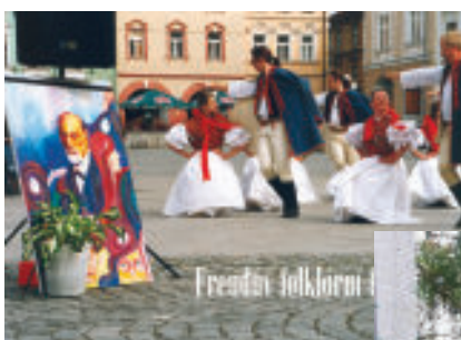
← Freudův folklórní festival

Ti z vás, kteří jste se tohoto „mini“ festivalku zúčastnili v loňském roce, jistě potvrdíte, že se zde nerozdávaly pouze ceny a diplomy, ale i radost ze „šťavnaté“ cimbálové muziky.