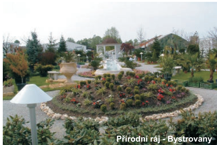
Přírodní ráj - Bystrovany

„Musím zaklepat, ne. Může vám to znít jako fráze, ale profesionální stav techniky i řidičů je pro naši agenturu samozřejmostí. Včetně ohledů právě na seniory. Pro zajímavost, když byl před dvěma roky v Ostravě pan prezident Klaus, vybral si náš autobus. Seděl na čísle 23 a jeho žena Livie na čísle 24.“