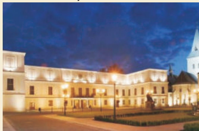
Zámek Karviná - Fryštát ▼