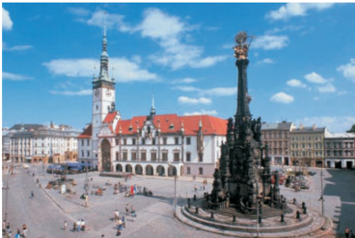
Olomouc - náměstí

V autobuse jsou mírně cítit tvarůžky, ale z tváří čtyřiceti seniorů, především tedy senierek, vyzařuje spokojenost. Jednodenní zájezd Ostrava - Loštice Litovel - Olomouc - Bystrovany - Ostrava se chýlí ke konci. Klaplo úplně všechno, včetně pocitu naprosto bezpečné jízdy.