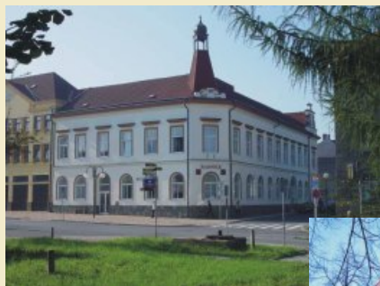
Mariánskohorská radnice a domy sídliště Fifejdy