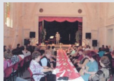
Polský dům 28. 11. 2003