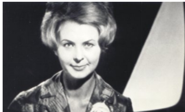
Foto, zaslané televizním divákem