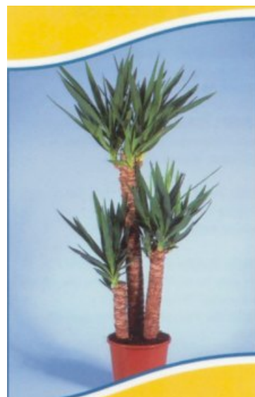
Cena pro vítěze

Takové byly tedy začátky. Několik fotografií přišlo poštou i e-mailem a tak nakonec bylo z čeho vybírat.